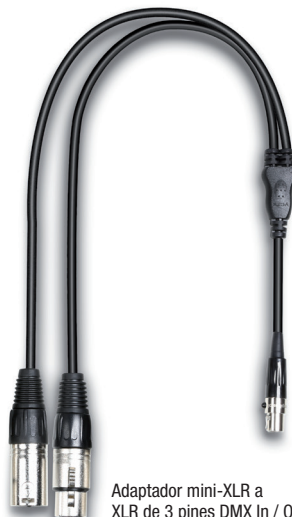
Adaptador mini-XLR a XLR de 3 pines DMX In / Out