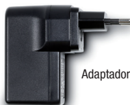
Adaptador de corriente