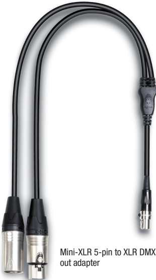
Mini-XLR 5-pin to XLR DMX in/ out adapter