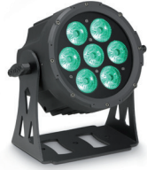
Other DMX Fixtures (i.e. CAMEO FLAT PRO 7)