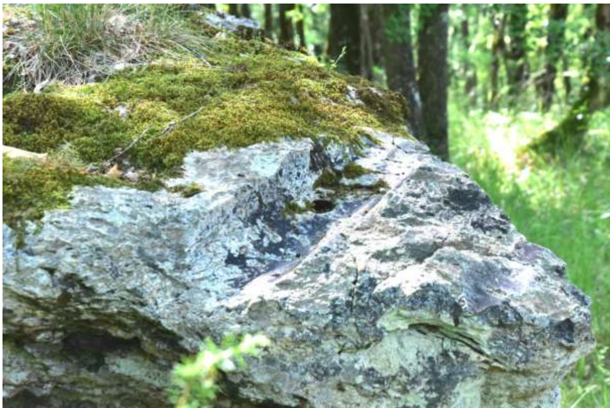
Fig. 6 : Le polissoir vu du nord

C'est un polissoir en calcaire calcédonieux local.