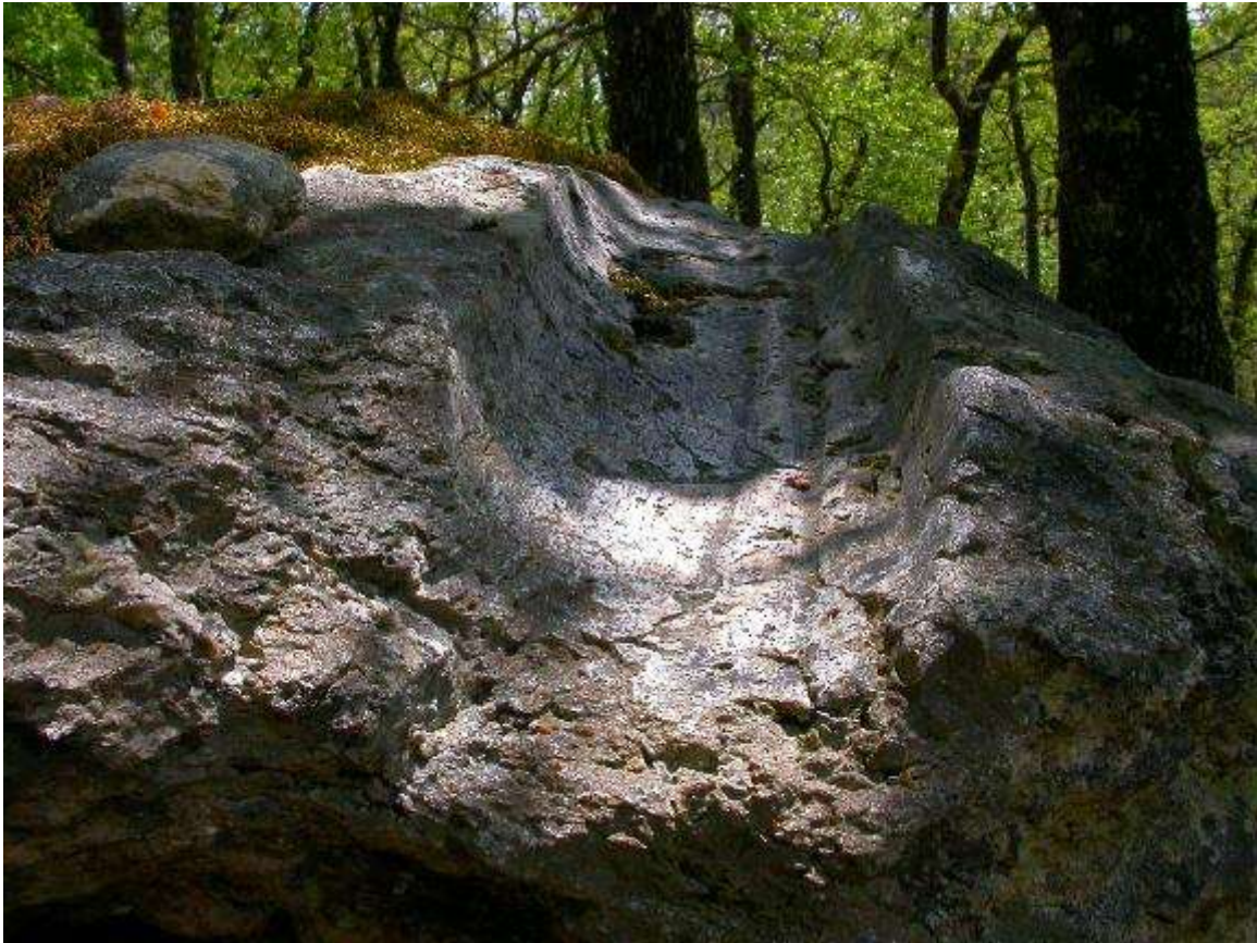
Fig. 7 : La gorge de polissage principale avec 2 sillons

Une excellente description en a été faite en 1939 par R L'honneur dans le Bulletin de la Société préhistorique française 36-10 p 428 à 432.