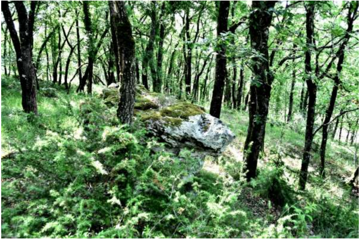
Fig. 1 : Le polissoir