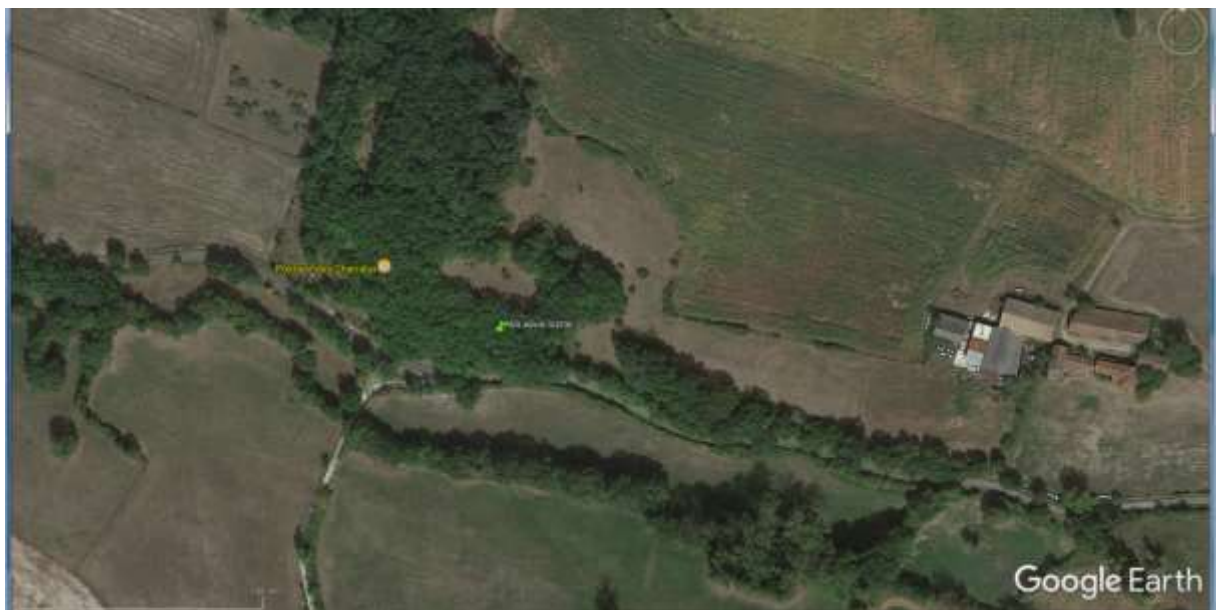
Fig. 4 : Vue aérienne du positionnement