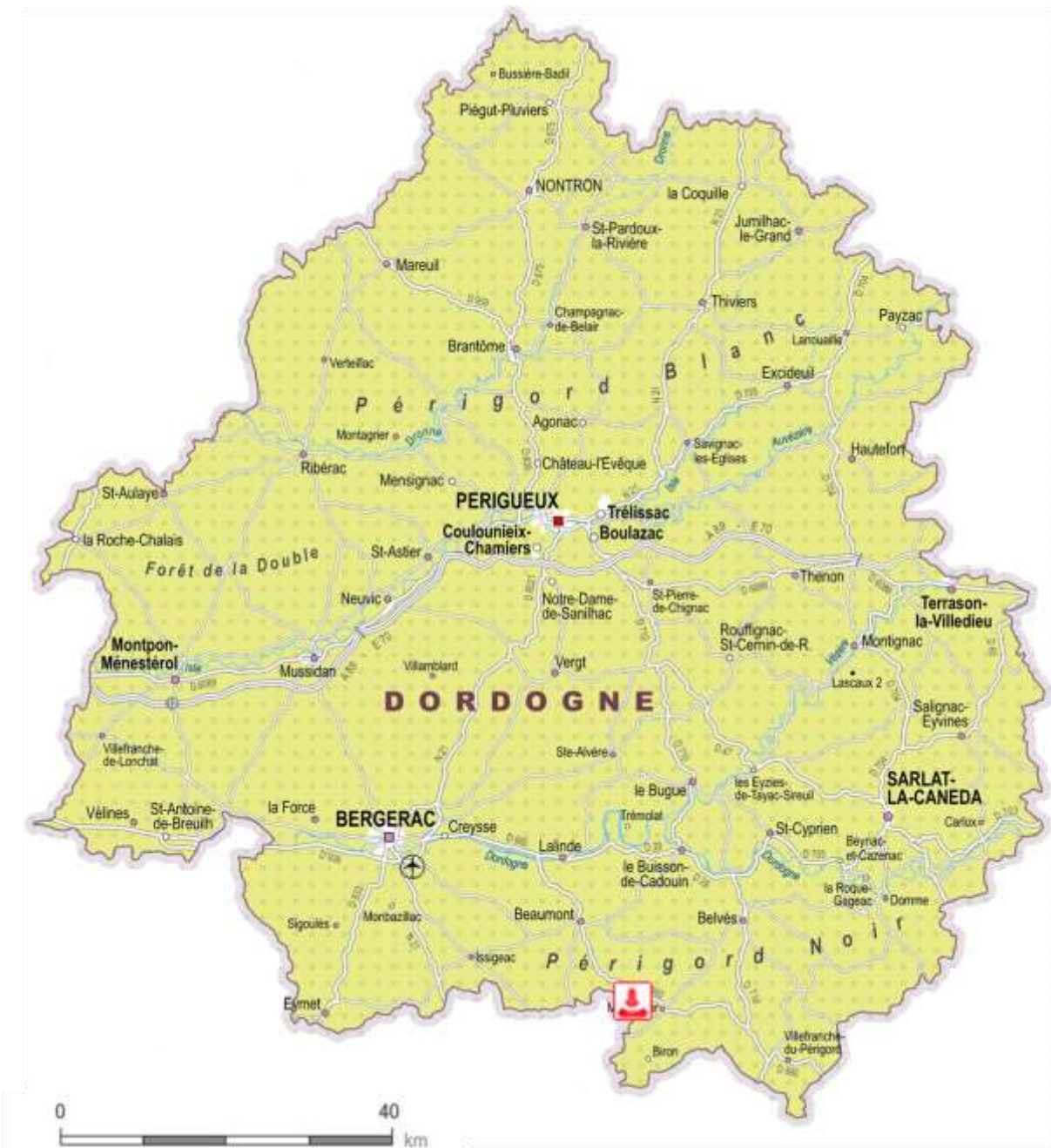
Fig. 2 : Position dans le département de la Dordogne