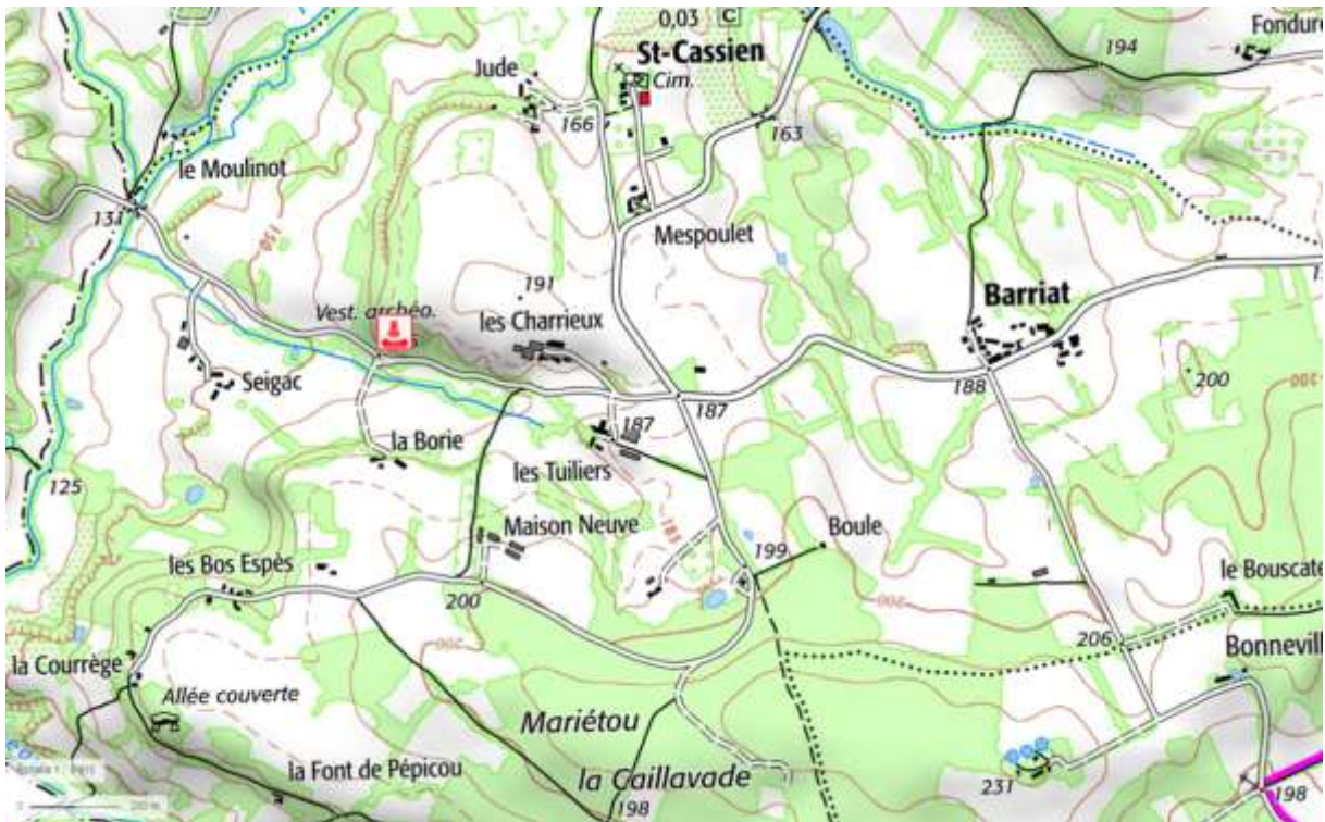
Fig. 3 : Carte IGN

Le polissoir est situé à proximité d'une route communale, sur un flanc de coteau exposé au sud. Un abri sous roche effondré se trouve à quelques dizaines de mètres, à l'est.