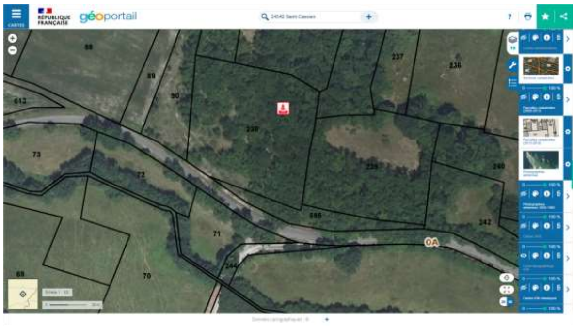
Fig. 5 : Cadastre

Le monument est situé sur la parcelle 0A 238.