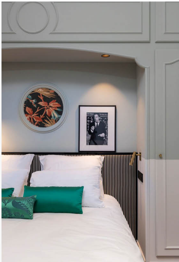
L'ambiance est inspirée du style de ce grand dandy parisien qu'était Serge