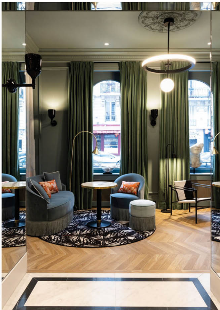
Hôtel Mercure Paris Gare de Lyon Opéra Bastille