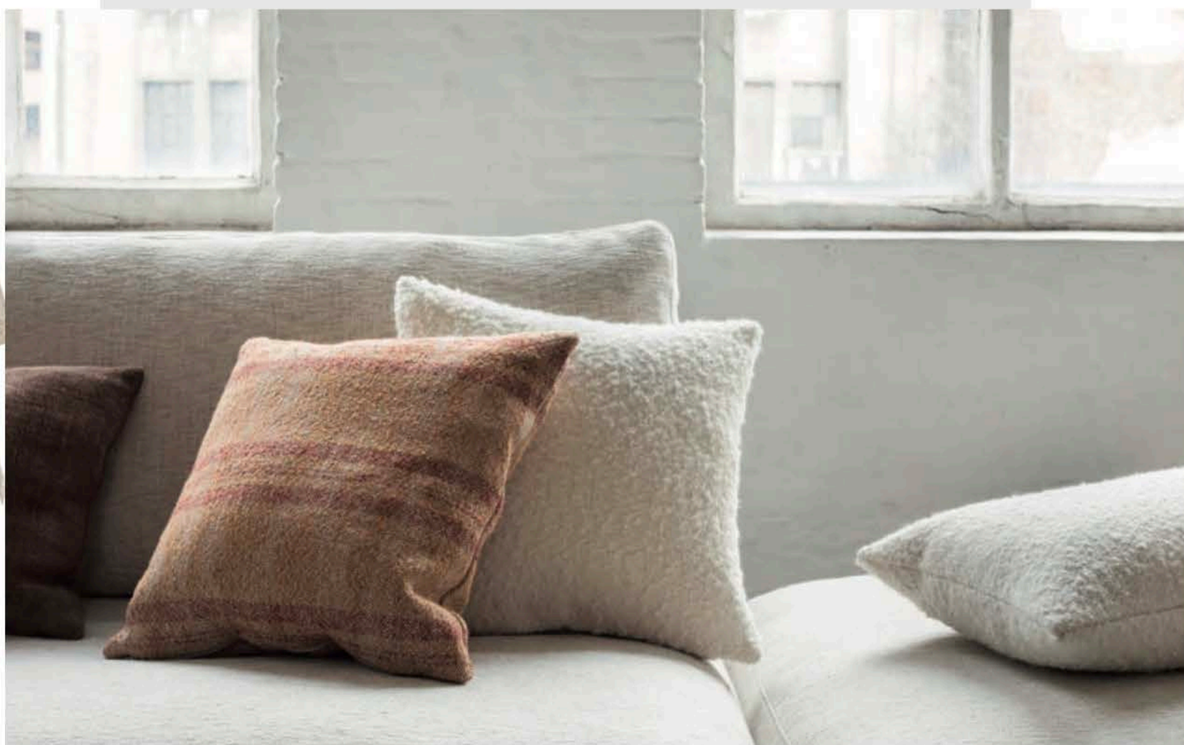
Bea Mombaers for Serax