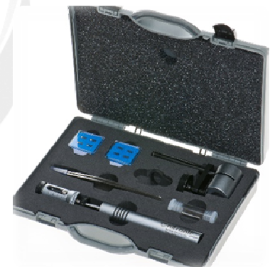
MiniStrip mit Advanced Set