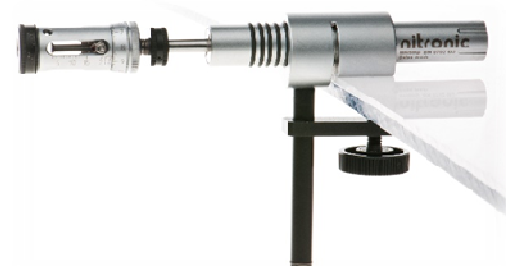
MiniStrip mit Tischhalter