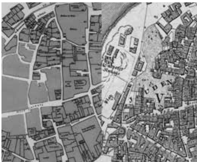
JOSEFOV – TOMKŮV PLÁN Z ROKU 1892 ZACHYCUJÍCÍ PRAHU V ROCE 1419 (VLEVO) VS. JÜTTNERŮV PLÁN PRAHY Z ROKU 1815 (VPRAVO)