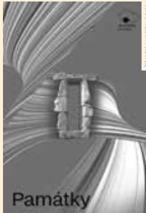
Národní památkový ústav

ČESKÉ BUDĚJOVICE | V prosinci 2023 vydal Národní památkový ústav jihočeské číslo časopisu Památky, které navazuje na úspěšnou řadu sborníků Památky jižních Čech. Periodikum seznamuje odbornou i laickou veřejnost s památkovým fondem a péčí o něj v jednotlivých regionech Česka.