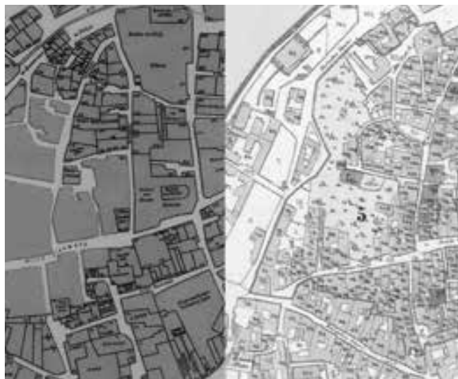
JOSEFOV – TOMKŮV PLÁN Z ROKU 1892 ZACHYCUJÍCÍ PRAHU V ROCE 1419 (VLEVO) VS. POVINNÝ CÍSAŘSKÝ OTISK MAPY STABILNÍHO KATASTRU Z ROKU 1842 (VPRAVO)