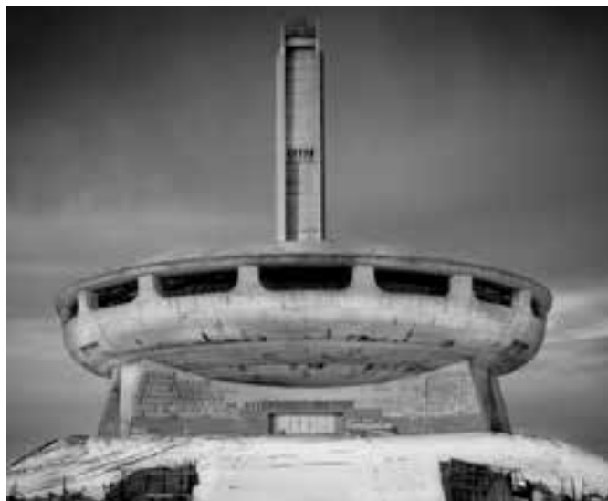
OD ROKU 2021 SE PAMÁTNÍK BUZLUZHA V BULHARSKU PROMĚŇUJE V ŽIVÉ KULTURNÍ CENTRUM.