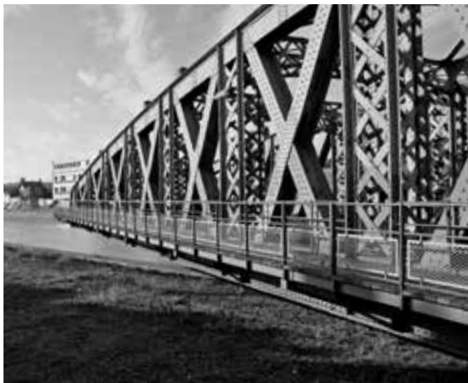
COLBERTŮV MOST V DIEPPE VE FRANCII JE POSLEDNÍ OTOČNÝ MOST S PŮVODNÍM MECHANISMEM V EVROPĚ.