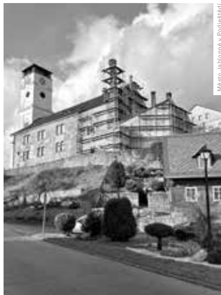
Město Jablonné v Podještědí