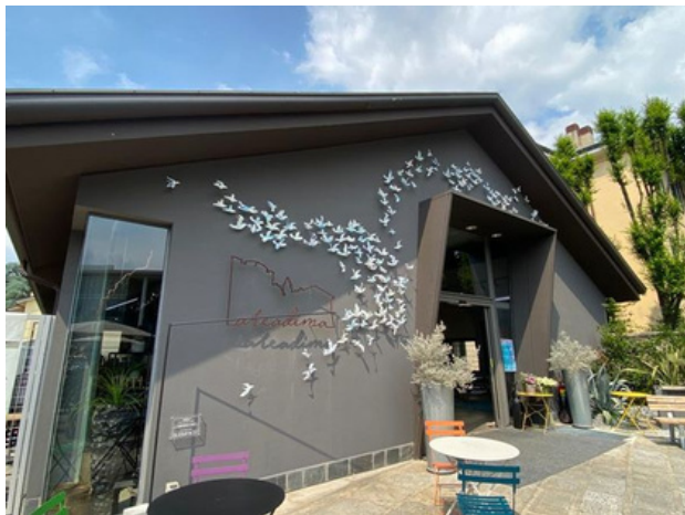
L'opera d'arte partecipata IN VOLO

Il progetto è a cura di ArteVOX , con il contributo di Fondazione della Comunità di Monza e Brianza e BrianzAcque.