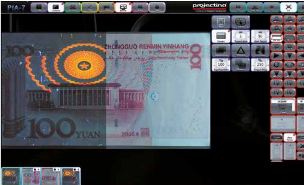
■ Horizontale oder vertikale Schnittbildvergleiche