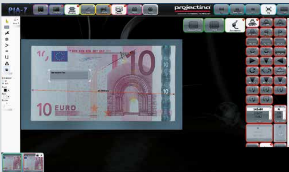
■ Messen von Distanz, Winkel, Kreisdurchmesser sowie Einfügen von Text und Markierungen