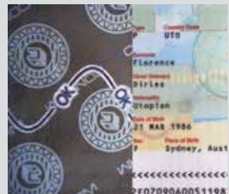
■ Sichtbarmachen von retroreflektierenden Sicherheitsmerkmalen