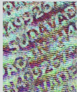
■ IPI (Invisible Personal Information)