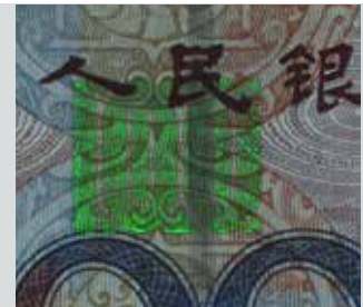
■ Infrarot 740 - 1100 nm Beleuchtung für „anti-Stokes inks“ Untersuchungen