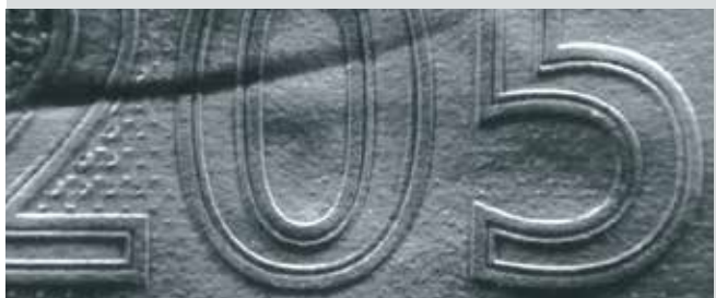
Stichtiefdruck mit IR-Absorption