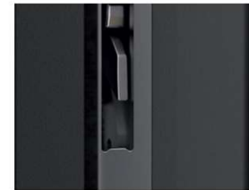
Haken in open positie