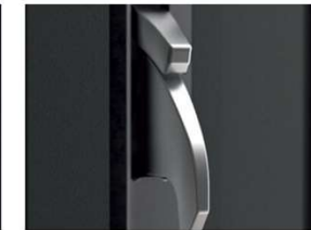
Slot is vergrendeld