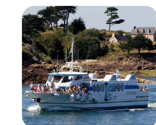
Les Vedettes de Bréhat

3 Opérations de cession 14,3% TRI brut** réalisé par 123IM 1.64 x Multiple* réalisé par 123IM