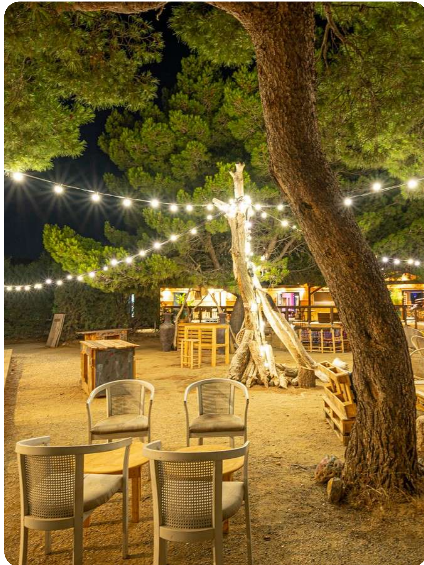
Camping Viglamo – Leucate. En portefeuille depuis 2019

Le Fonds est réservé aux investisseurs autorisés selon l'article 423-49 RGAMF. Investir dans le Fonds présente des risques de perte en capital et d'illiquidité.