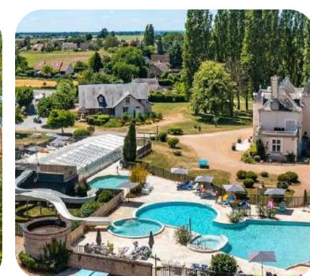
Le Château des marais