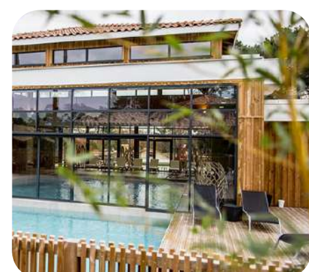
Domaine du Ferret