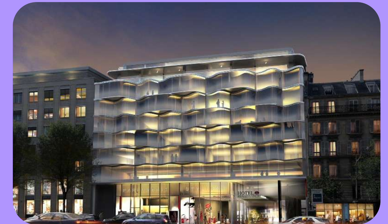
Renaissance Arc de Triomphe - Paris