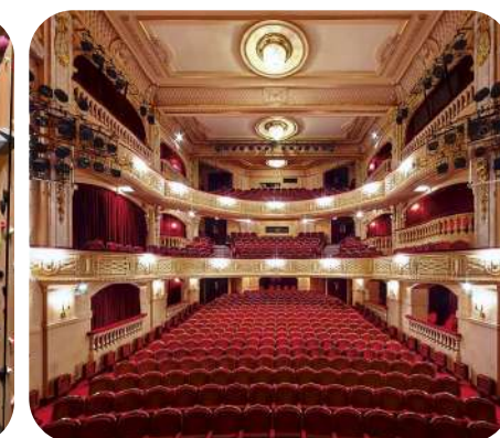
Théâtre Edouard VII

3 Opérations de cession 14,3% TRI brut** réalisé par 123IM 1.64 x Multiple* réalisé par 123IM