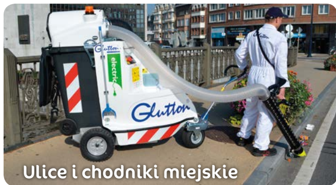
Ulice i chodniki miejskie

Odkurzacz Glutton® to gwarancja czystości w Twoim mieście, która zapewni zadowolenie mieszkańców i większy komfort personelu sprząającego.