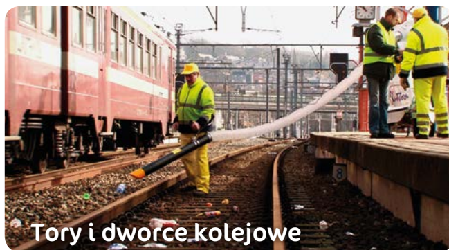
Tory i dworce kolejowe