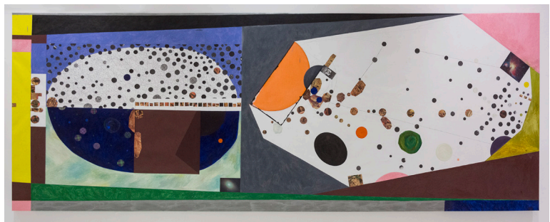
James hd Brown | Sofa Size Painting, 2018 | Óleo sobre lino | 200 x 510 cm