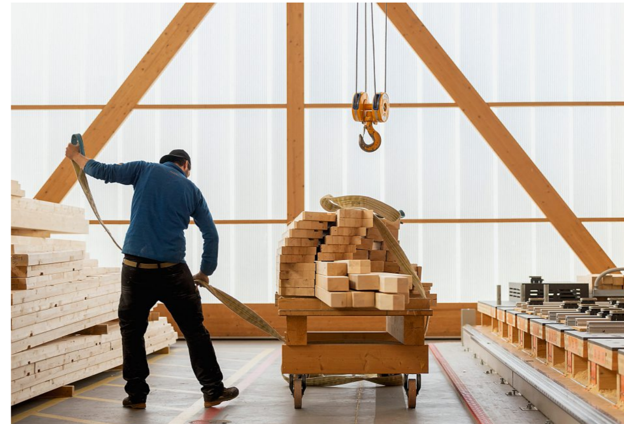
Ein Arbeiter stellt die benötigten Elemente für einen Quadrin zusammen: Montagehalle der Uffer AG in Savognin.

«Als Unternehmer stehe ich in der Verantwortung, unseren ökologischen Fussabdruck klein zu halten.»