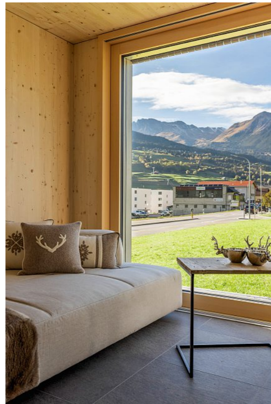
Behagliches Ambiente: Der hölzerne Wohnwürfel eignet sich zum Leben, aber auch etwa als VIP-Lounge oder als Kassenhäuschen.