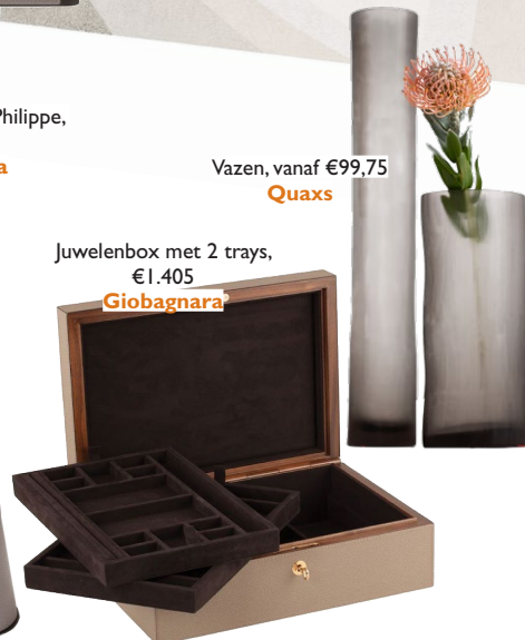
Vazen, vanaf €99,75 Quaxs