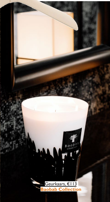
Geurkaars, €113 Baobab Collection