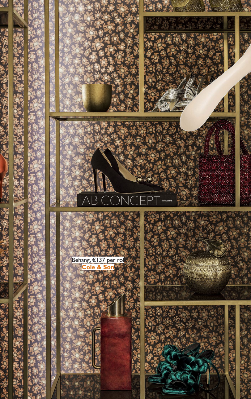
Behang, €137 per rol Cole & Son