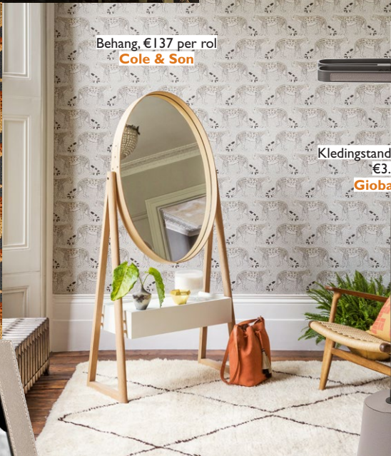
Behang, €137 per rol Cole & Son