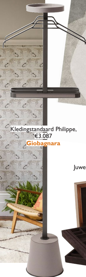
Kledingstandaard Philippe, €3.087 Giobagnara