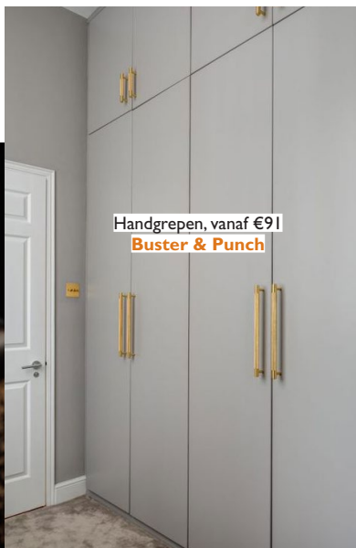
Handgrepen, vanaf €91 Buster & Punch