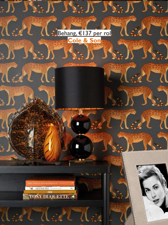
Behang, €137 per rol Cole & Son