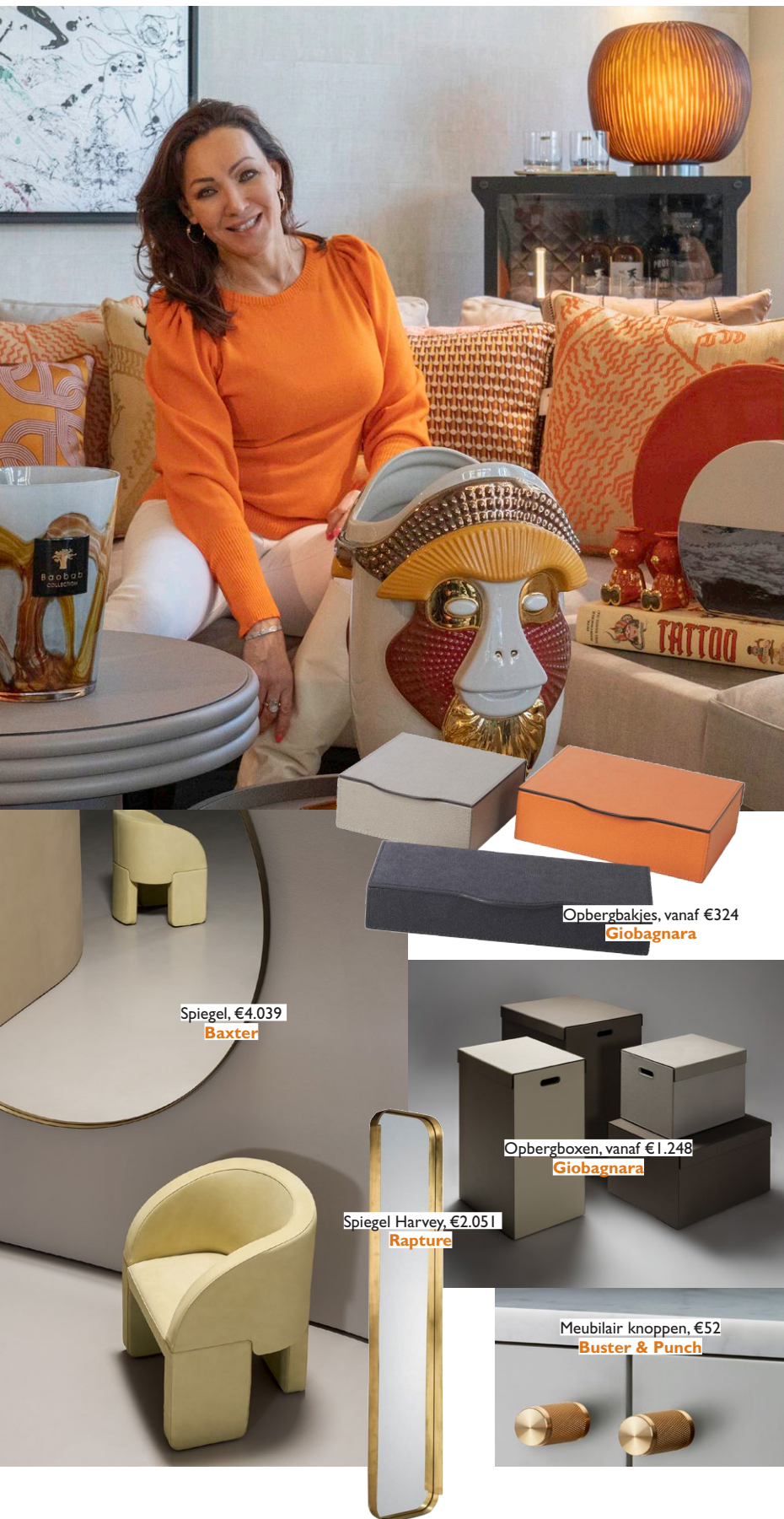
Spiegel, €4.039 Baxter