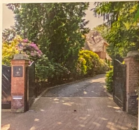
De toegangspoort van de villa ligt aan het einde van een honderd meter lange bomenlaan. Het enorme grondstuk biedt optimale rust en privacy.

De villa's die Karel Petrus Cornelis de Bazel aan het begin van de twintigste eeuw ontwierp, waren imposant en welstandig. Hetzelfde kan worden gezegd van zijn cliëntèle. Rijke zakenmensen, industriëlen, kunstenaars en gefortuneerde adellijke families waren uiterst gecharmeerd van de verfijnde en kostbare ontwerpstyl van De Bazel. In het Gooi zijn meerdere door hem ontworpen villa's gebouwd, maar de gevierde architect draaide ook zijn hand niet om voor een complete villawijk, zoals het Brediuskwartier in Bussum. Zijn magnum opus is 'De Bazel', gebouwd als hoofdkantoor van de Nederlandsche Handel Maatschappij aan de Vijzelstraat in Amsterdam, maar tegenwoordig is hier het Stadsarchief Amsterdam gevestigd. De architect zelf mocht de voltooiing in 1926 helaas niet meer meemaken, hij overleed in 1923 op 54-jarige leeftijd. De robuuste, onverzettelijke architectuur van gebouw De Bazel staat in schril contrast tot de uitstraling die hij de meeste van zijn villa's gaf. Kijk maar eens naar dit rietgedekte landhuis aan de Sint Janstraat 57 in Laren. Het vormt de perfecte omlijsting van het rijke en romantische landleven waarvan de gegoede burgerij anno 1900 graag in deze contreien genoot. De Bazel ontwierp Villa 'De Leeuwerik' in 1913 voor Joseph de Leeuw, eigenaar van het bekende mode- en interieurwarenhuis Metz & Co