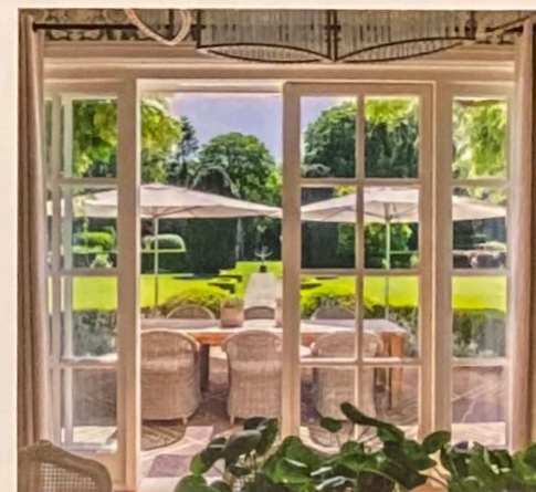
De woonvertrekken op de begane grond liggen gemoedelijk rond de centrale entreehal gegroepeerd. Let op de fraaie detaillering in de eetkamer.

De villa is met een woonoppervlakte van 430 m 2 fors bemeten, maar de elf vertrekken voegen zich gemoedelijk rond de hal, die centraal in de villa ligt. De gezellige woonkamer, met open haard en twee erkers, ligt links van de hal. De prachtige eetkamer, met cassetteplafond en openslaande deuren naar het bordes, is zowel vanuit de hal als de woonkamer bereikbaar. Daarnaast, in de rechtervleugel van de villa, bevindt zich de riante woonkeuken met ook hier een fraaie erker met zitbank en openslaande deuren naar een terras op het zuidwesten. Aansluitend zijn twee werkkamers, waarvan een met open >