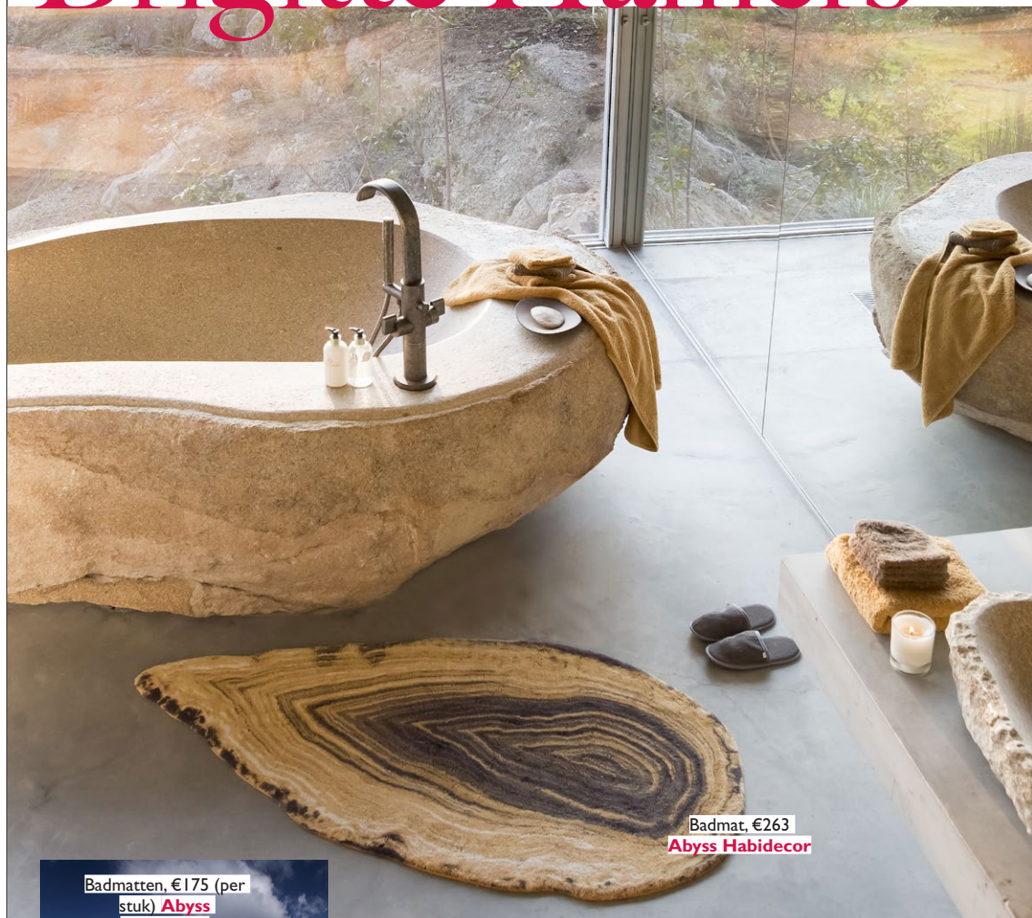
Badmat, €263 Abyss Habidecor