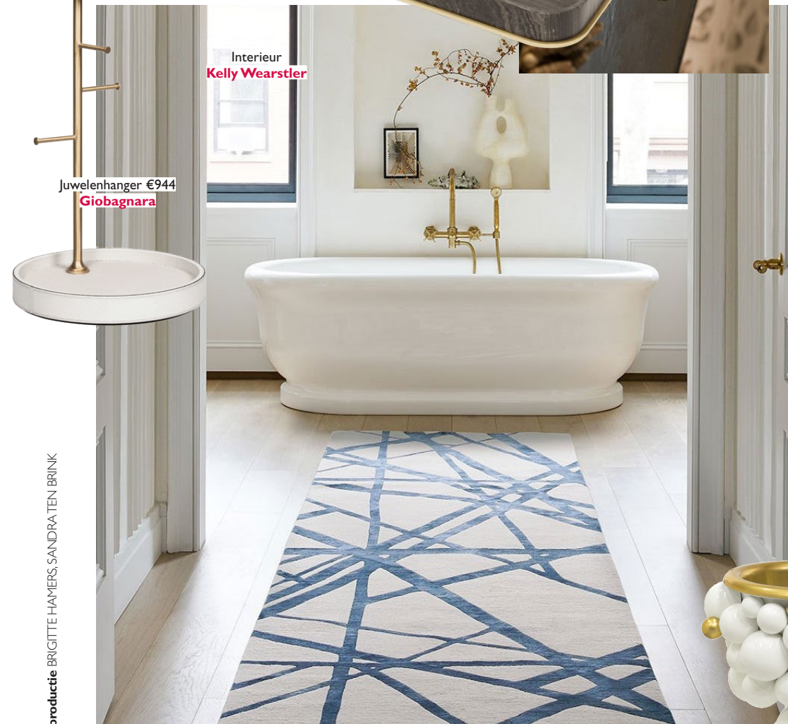
Juwelenhanger €944 Giobagnara

badkamer, bijvoorbeeld leer-behang of vinyl. En kunst als out-of-the-box-element (denk aan een rustgevende zen-afbeelding of een sensuele plaat). Plaats een poefje of een stoeltje, dat is handig bij het insmeren. En houd het clean. 'Rommel' stop je in kastjes en plaats alleen een tray met fraaie dingen, zoals parfums. Als je om je heen kijkt, wil je alleen maar mooie items zien. Het toppunt van een luxe gevoel: een badkamer die doorloopt naar de slaapkamer, met openslaande deuren. Misschien moet er een muurtje voor wijken, maar geloof mij, dat is het waard.