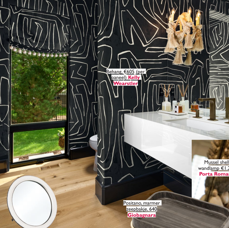
Behang, €605 (per paneel) Kelly Wearstler