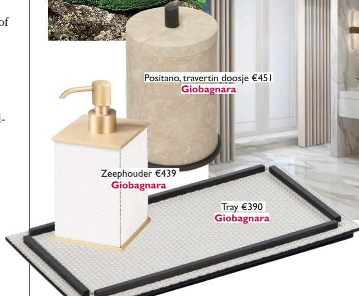
Positano, travertin doosje €45 | Giobagnara