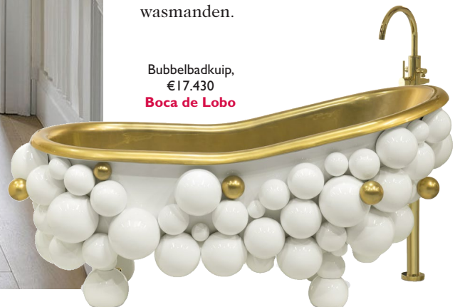
Bubbelbadkuip, €17.430 Boca De Lobo