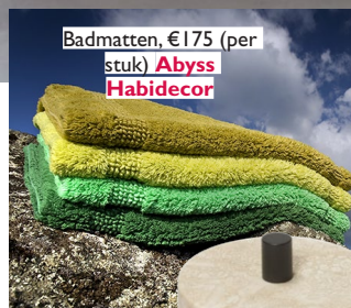
Badmatten, €175 (per stuk) Abyss Habidecor