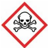
AKUT GIFTIG (FARLIGE)