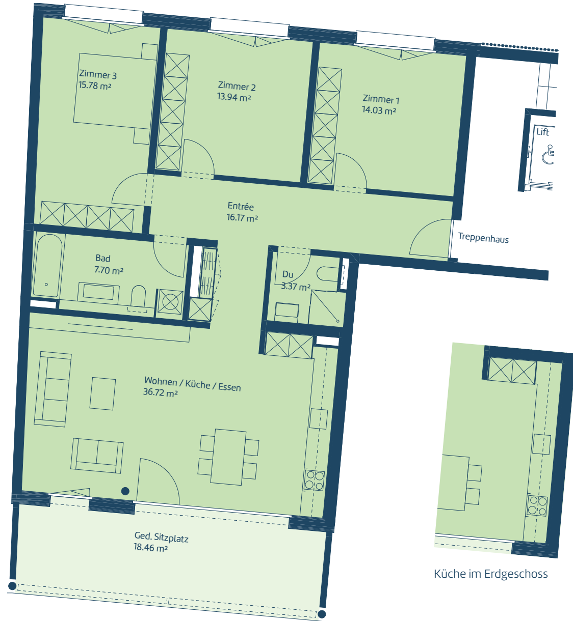
Küche im Erdgeschoss