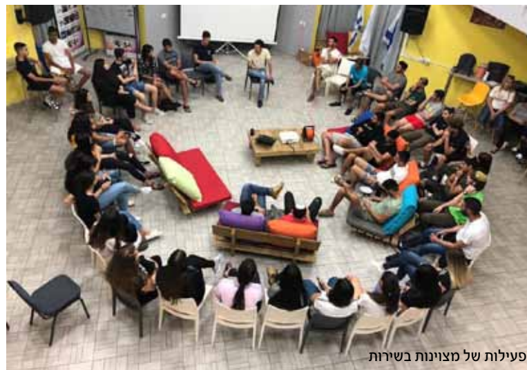
פעילות של מצוינות בשירות

"פרויקט נוסף שיקר מאוד לליבנו", אומרים בקבוצה, "הוא השתתפות ותמיכה במיזם 'להעז' של בוגרי סירת מטכ"ל. המיזם הוא חלק מעמותת 'מסדר דורשי טוב', שהוקמה בשנת 1967 כארגון המאגד ומאחד את בוגרי היחידה. מטרת