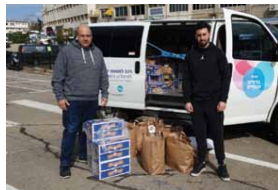
מתנדבי גדולים מהחיים מגיעים לסייע למשפחות חולים שנקלעו למצוקה בקורונה

כשהמשפחה מגלה שאחד הילדים חולה בסרטן, כל עולמם מתהפך. החיים כפי שהכירו אותם עד אז נעצרים והם מוצאים את עצמם במציאות חדשה. כשהקורונה נכנסת לתמונה, המצב המורכב ממילא הופך למשבר שקשה להתאושש ממנו