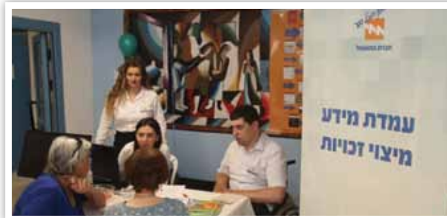
נציגי חברת החשמל מסייעים ללקוחות למצוא את זכויותיהם מול החברה

סיירת ילדי נתיב האור" נשמע אולי כמו שם של סדרת ספרי מתח לילדים, אבל בפועל מדובר במשהו מקסים ומרגש יותר: סיירת ילדים אמיתית הפועלת בלא מעט יישובים ברחבי הארץ. תוכנית "נתיב האור", שפועלת כבר משנת 2005, היא, למעשה, תוכנית חינוכית-קהילתית, שמפעילה חברת החשמל בשיתוף משרד החינוך ומרכז השלטון המקומי.