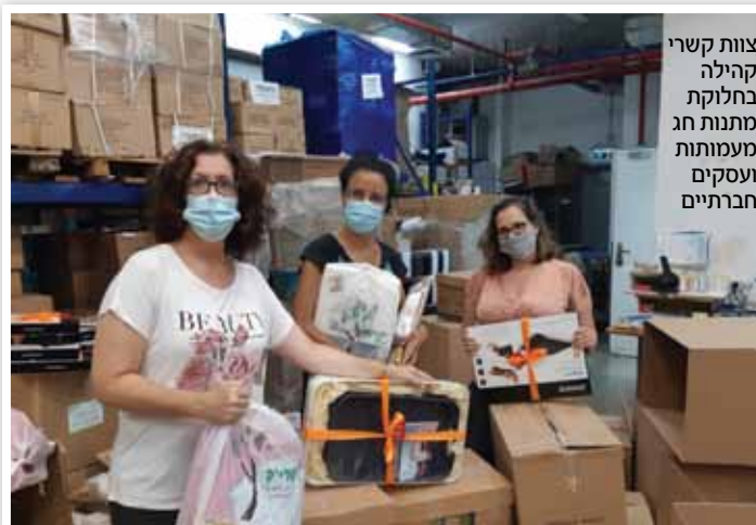
צוות קשרי קהילה בחלוקת מתנות חג מעמותות ועסקים חברתיים

כך, למשל, הקימה מזרחי טפחות בקהילה נבחרת מנטורים אדי-הוק מתוך אנשי הבנק, שתסייע ביעוץ מקצועי למיזמים חברתיים ש"נתקעו" כתוצאה מהקורונה. שניים מהמיזמים היו מבית "הכוורת" בלוד, חממה ליזמות חברתית שבה הבנק תומך דרך קבע: אפליקציה המבוססת