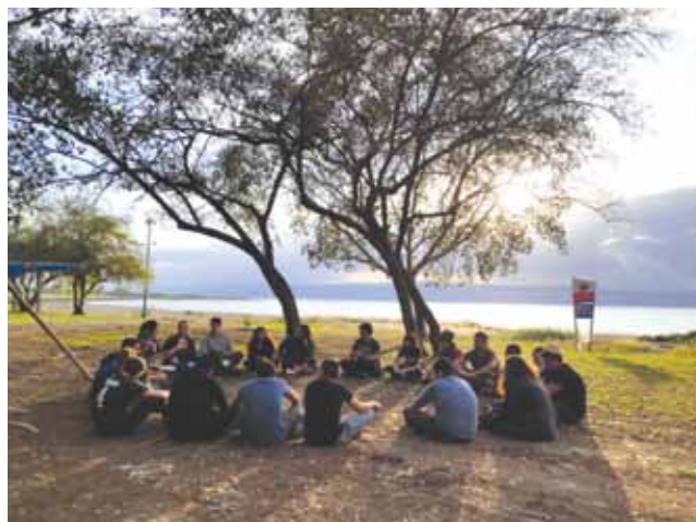
תוכנית קו הזינוק, צילומים: יח"צ

הצעירים מקבלים כלים וליווי שמאפשרים להם להשתלב באקדמיה ובחברה הישראלית". התפרצות מגפת הקורונה, על פי נחמיה-לביא, האירה עוד יותר את הצורך בפיתוח דור של מנהיגים. "לפני הקורונה, בניית מנהיגות צעירה נחשבה לפריבילגיה, למותרות. הגישה הייתה שחשוב יותר לטפל באוכלוסיות קצה. הקורונה הוכיחה כמה פיתוח המנהיגות הוא חיוני לחברה שלנו. כשפרצה המגפה והמשק ירד ל-15% פעילות, ב'שותפויות רוטשילד' לא רק שלא הפסקנו פעילות ולא הוצאנו עובדים לחל"ת, אלא התגייסנו מיידית לאינספור זירות סיוע. כמעט 700 מבוגרי ומשתתפי התוכניות שלנו נכנסו ליישובי הפריפריה והקימו בהם מוקדי חירום. מוקדים כאלה הוקמו ב-50 יישובים, 40 יהודיים ועשרה ערביים. התפקוד של המוקדים האלה היה קריטי לתושבים וזה מוכיח עד כמה חשוב לטפח את המנהיגות הצעירה והמקומית בשגרה, על מנת שהחברה הישראלית תקבל מענה בחירום.