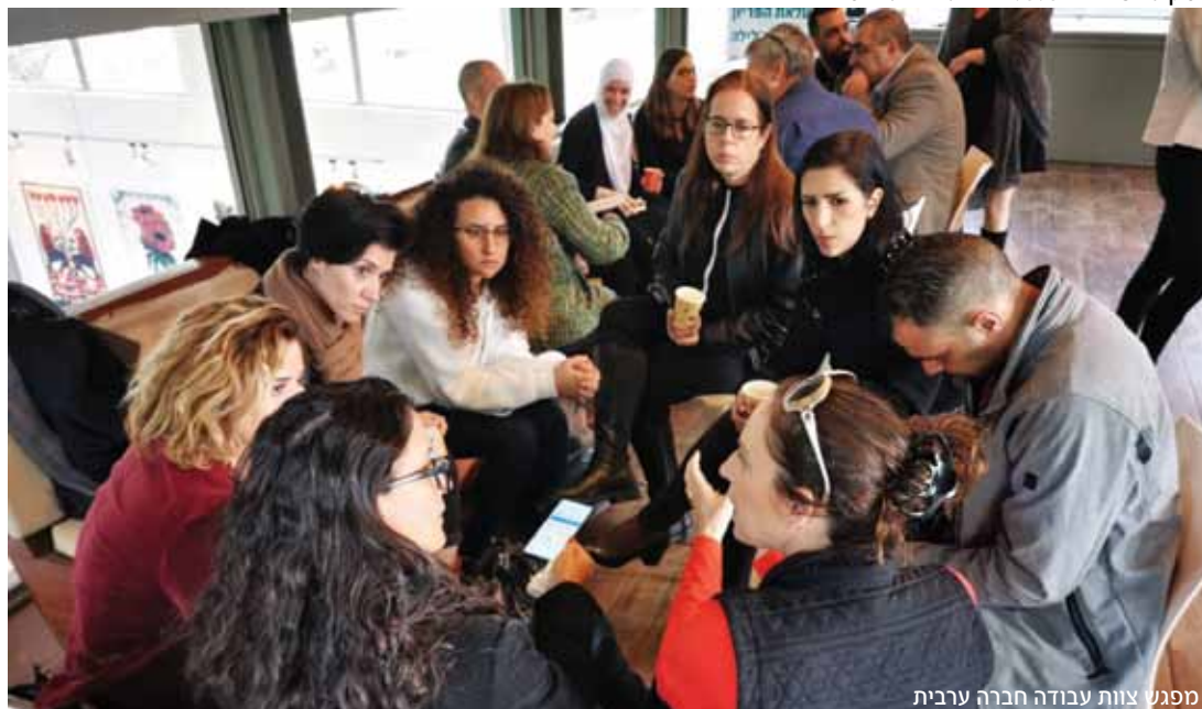
מפגש צוות עבודה חברה ערבית