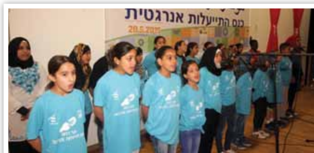
כנס התייעלות אנרגטית ברהט