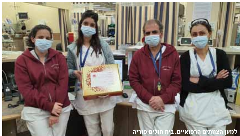
למען הצוותים הרפואיים. בית חולים פוריה