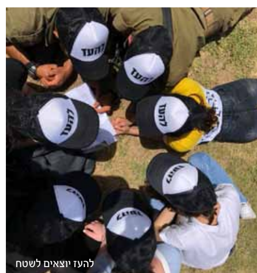
להעז יוצאים לשטח

"הקבוצה רואה בחיזוק הקשר בין החברה לקהילה חשיבות עליונה", אומרים בקבוצת FOX, "יחד ובשיתוף עובדי החברה, נפעל למען מימוש האחריות החברתית שלנו כחברה הקמעונאית המובילה במדינת ישראל ונמשיך להשקיע משאבים כספיים וארגוניים בעשייה למען החברה הישראלית".