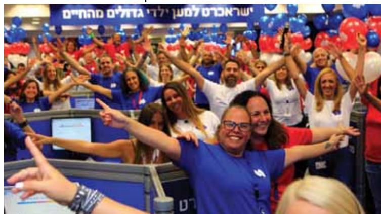
הקבוצה לובשת חג. אירוע גיוס הכספים השנתי ל"גדולים מהחיים"