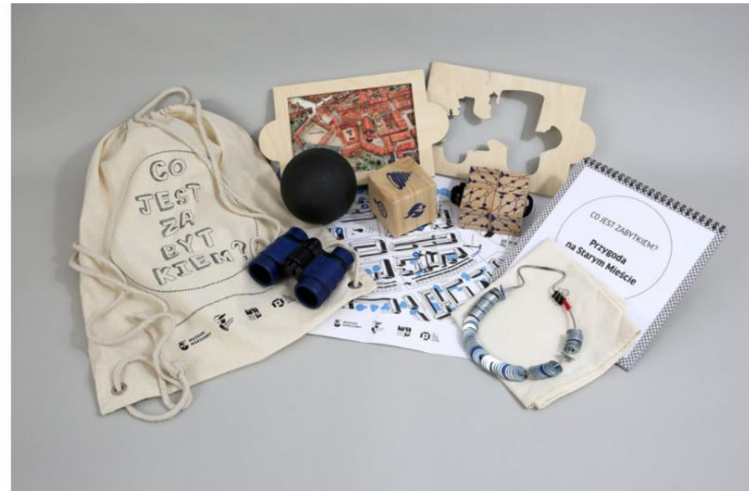
Міська гра "Вакаційні прогулянки з наплічником" (Wakacyjne spaceru z plecakiem), Музей Варшави