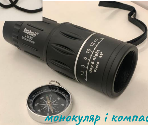
монокуляр і компас