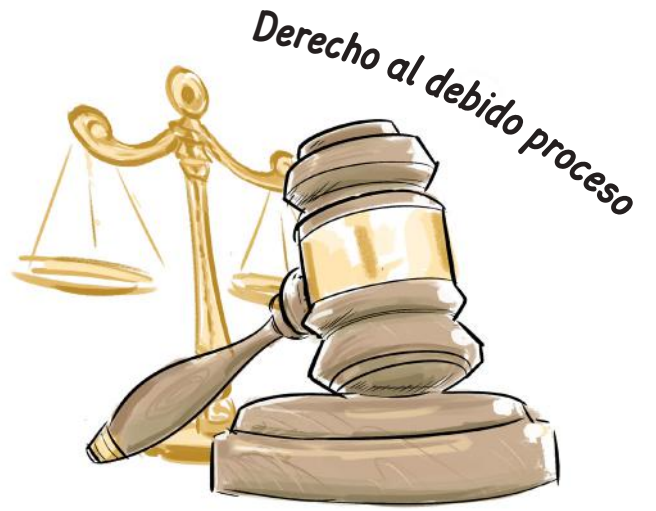
Derecho al debido proceso