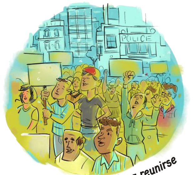
Derecho a reunirse