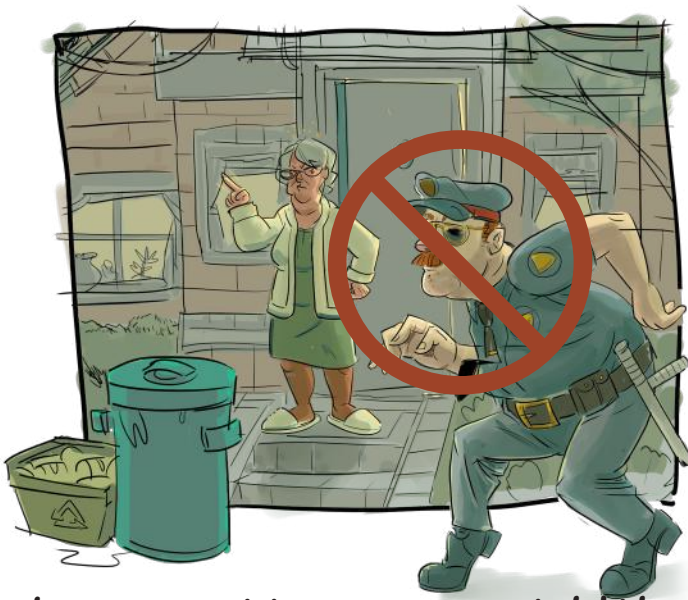
Derecho contra revisiones y arrestos indebidos