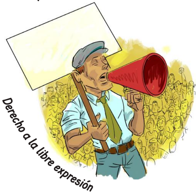
Derecho a la libre expresión