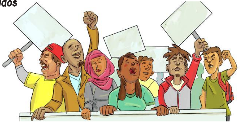
Derecho a igual protección