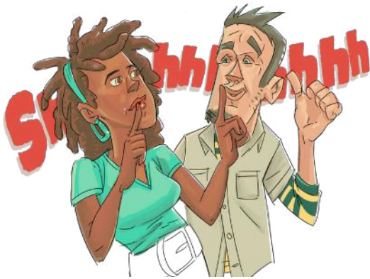
Derecho a permanecer callado