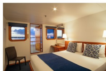
C & B Ocean Stateroom