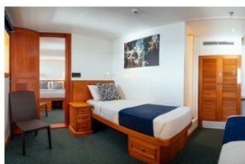
Connecting Family Ocean Stateroom