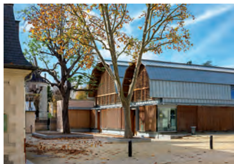
Espace Chanorier, un pôle artistique et culturel