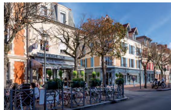
Boulevard Fernand Hostachy