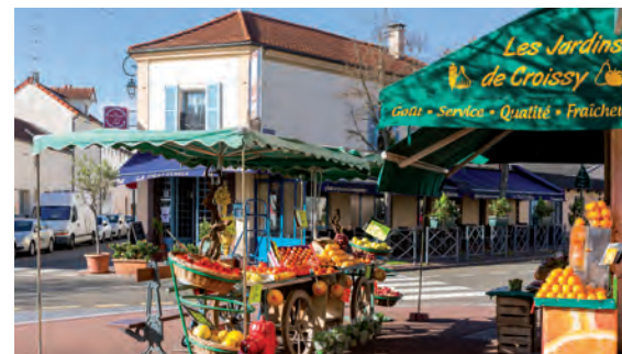
Place de la Patte d'Oie

Croissy-sur-Seine bénéficie enfin d'une excellente desserte par les transports en commun. À proximité de l'A14 et de l'A86, la ville accueille la station de RER A "Chatou-Croissy" permettant de rejoindre le pôle de La Défense en 12 minutes et le centre de Paris en 25 minutes*.