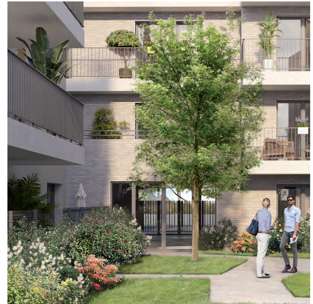
ILLUSTRATION À LA LIBRE INTERPRÉTATION DE L'ARTISTE - DOCUMENT NON CONTRACTUEL