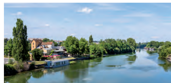
Restaurant La Maison Fournaise sur l'île des Impressionnistes