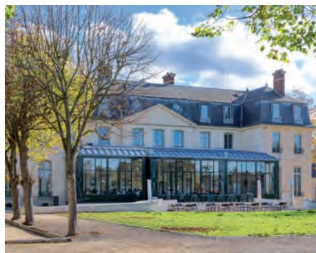
Verrière du château de Croissy