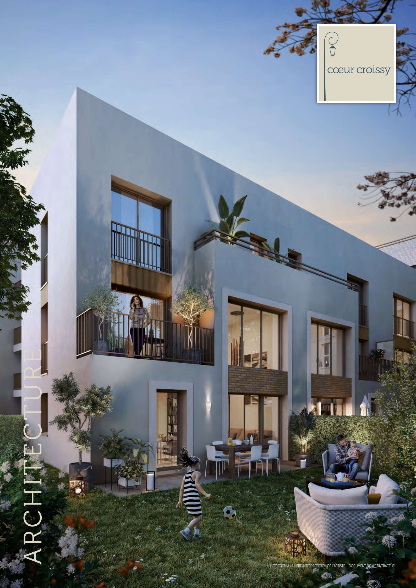
ILLUSTRATION À LA LIBRE INTERPRÉTATION DE L'ARTISTE - DOCUMENT NON CONTRACTUEL