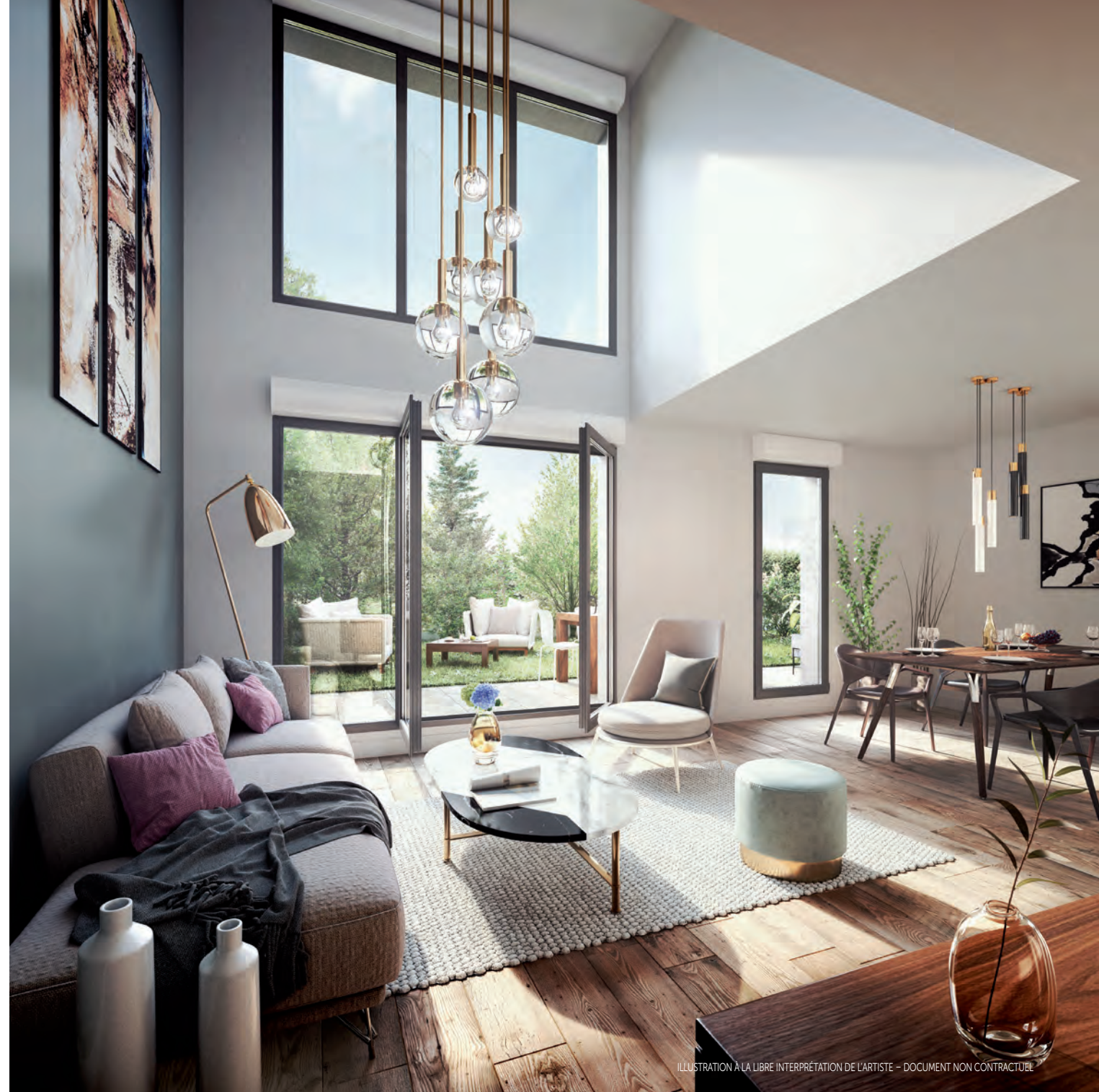
ILLUSTRATION À LA LIBRE INTERPRÉTATION DE L'ARTISTE - DOCUMENT NON CONTRACTUEL