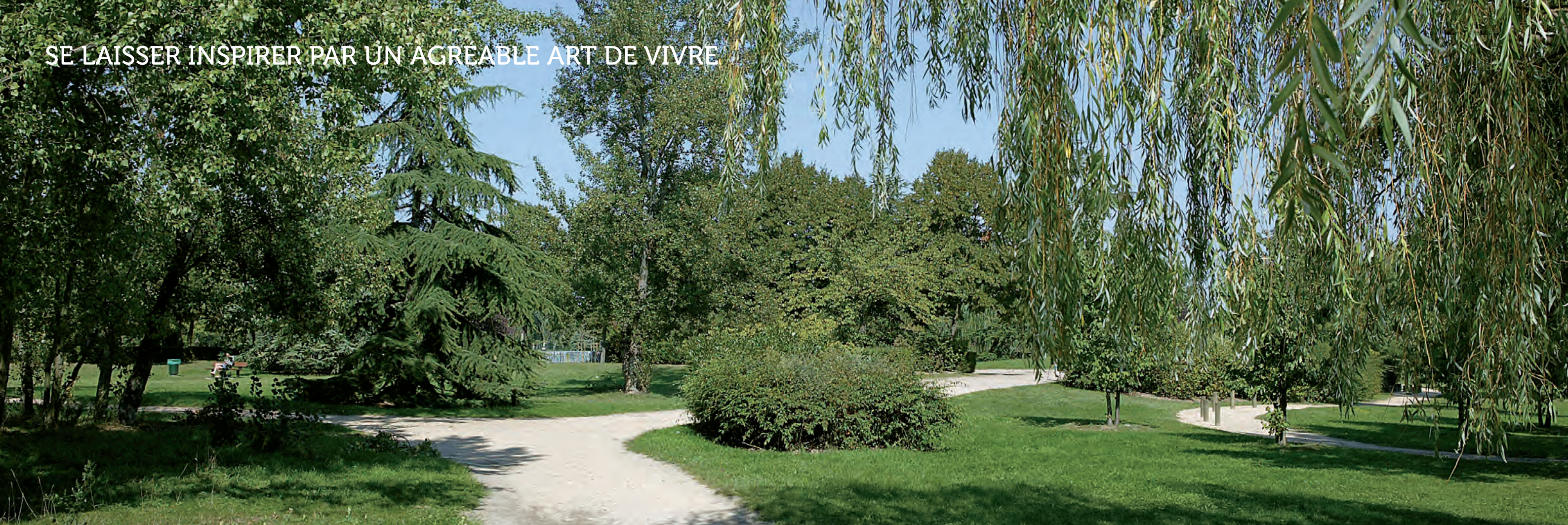
Le parc de l'île des Impressionnistes

SE LAISSER INSPIRER PAR UN AGREABLE ART DE VIVRE