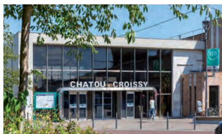
La Gare RER A de Chatou/Croissy

À 11 kilomètres* de la capitale, nichée dans un méandre de la Seine face à l'Île de la Chaussée, Croissy-sur-Seine bénéficie d'un environnement privilégié. Ce cadre pittoresque attira notamment les grands noms de l'impressionnisme du 19 e siècle, tels Monet, Sisley ou Degas, séduits par le charme des paysages naturels.