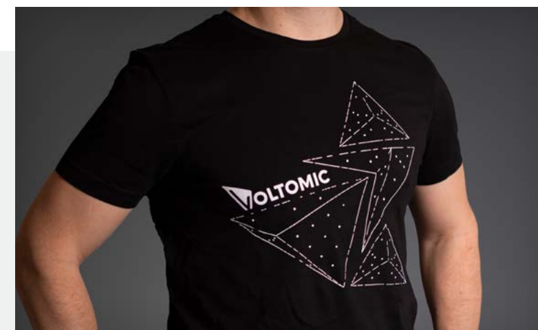
Referenz: Voltomic – T-Shirts