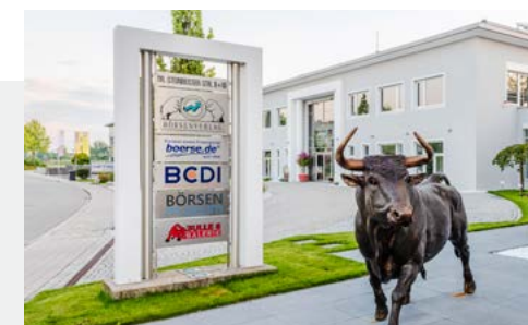
Referenz: boerse.de Group – Werbe pylone