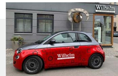
Referenz: Wilhelm – Fahrzeugbeschriftung