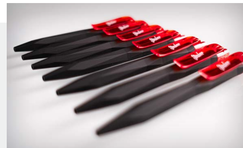
Referenz: Steuber – Kugelschreiber