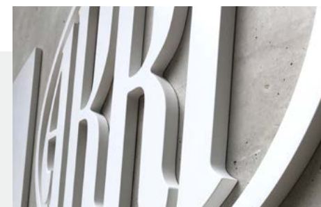
Referenz: ARRI – 3D-Buchstaben