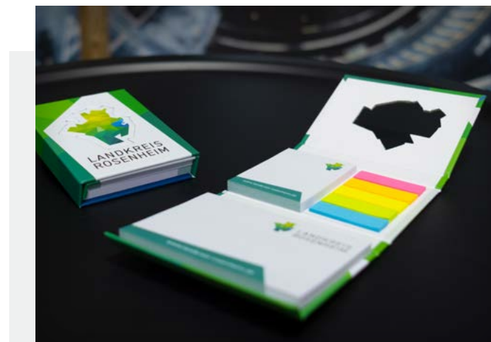
Referenz: Landratsamt Rosenheim – Haftnotizen