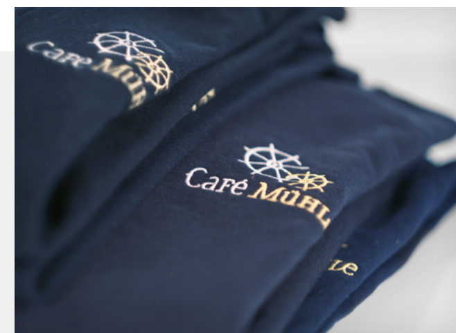
Referenz: Café Mühle – Poloshirts