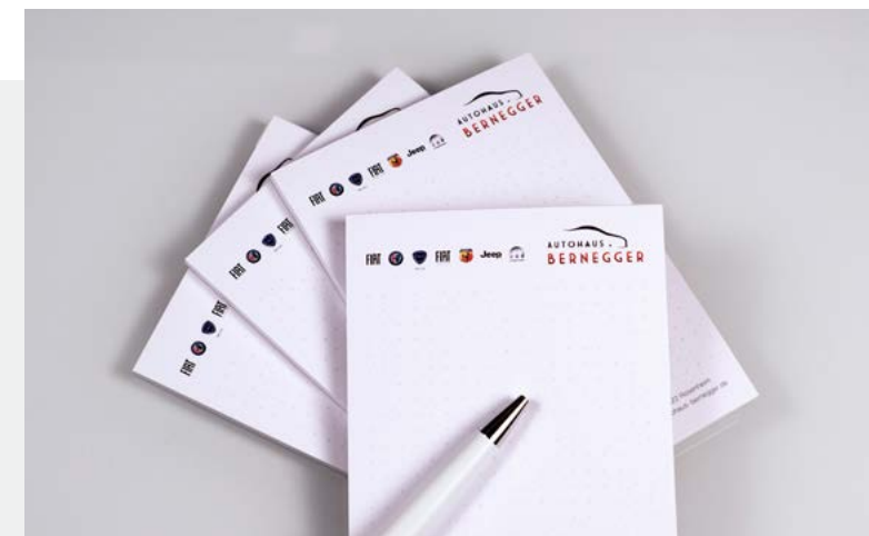
Referenz: Autohaus Bernegger – Schreibblöcke