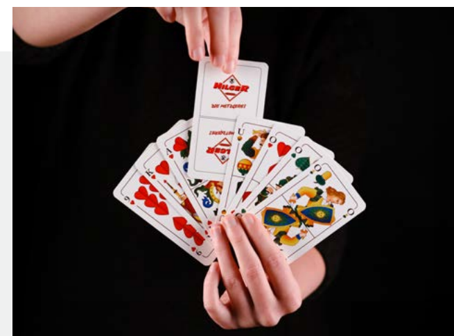
Referenz: Metzgerei Hilger – Spielkarten