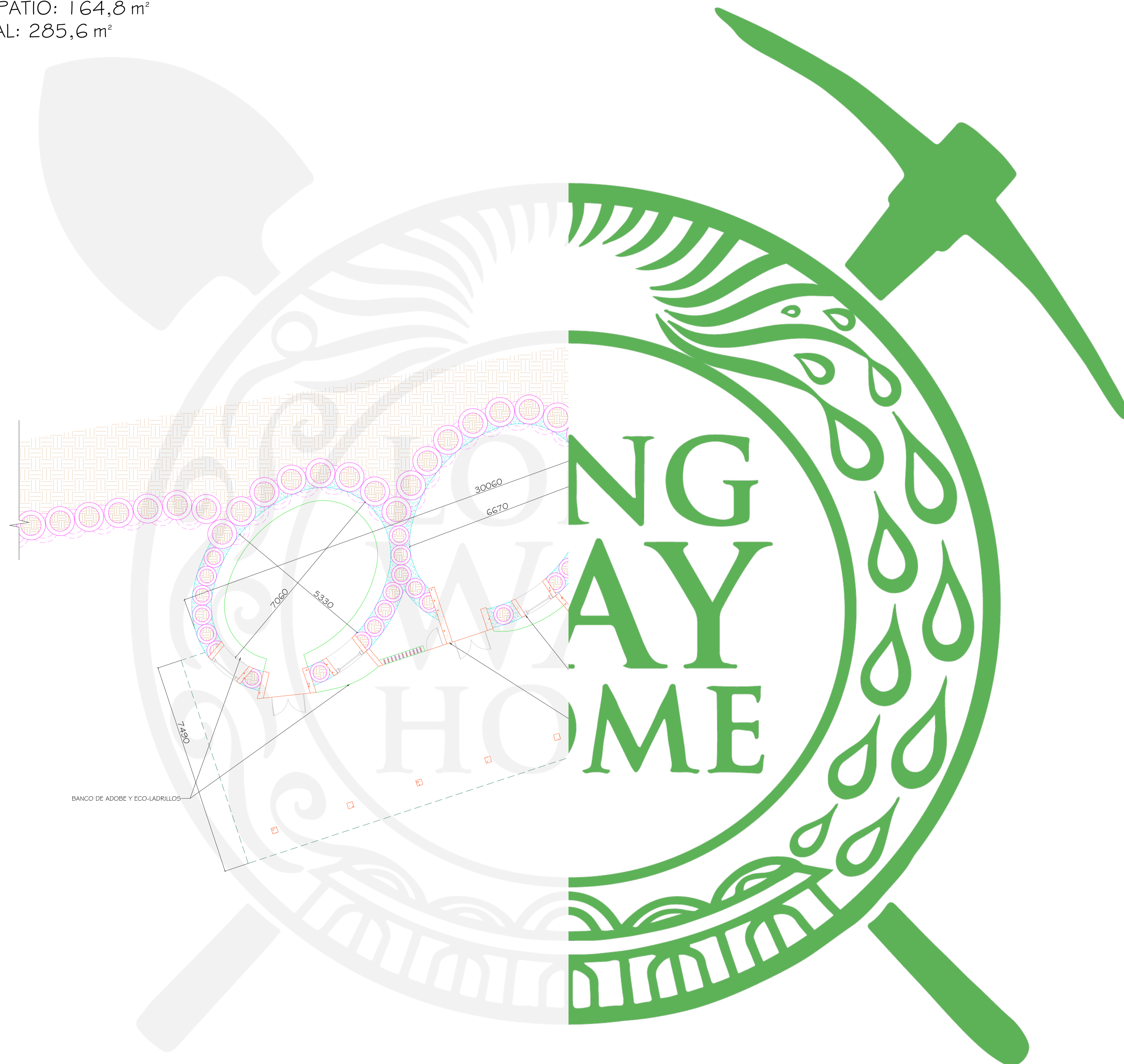
1 PLANO DE LA PLANTA BAJA 1:75

SUPERFICIE INTERIOR: 120,8 m 2 SUPERFICIE DEL PATIO: 164,8 m 2 SUPERFICIE TOTAL: 285,6 m 2