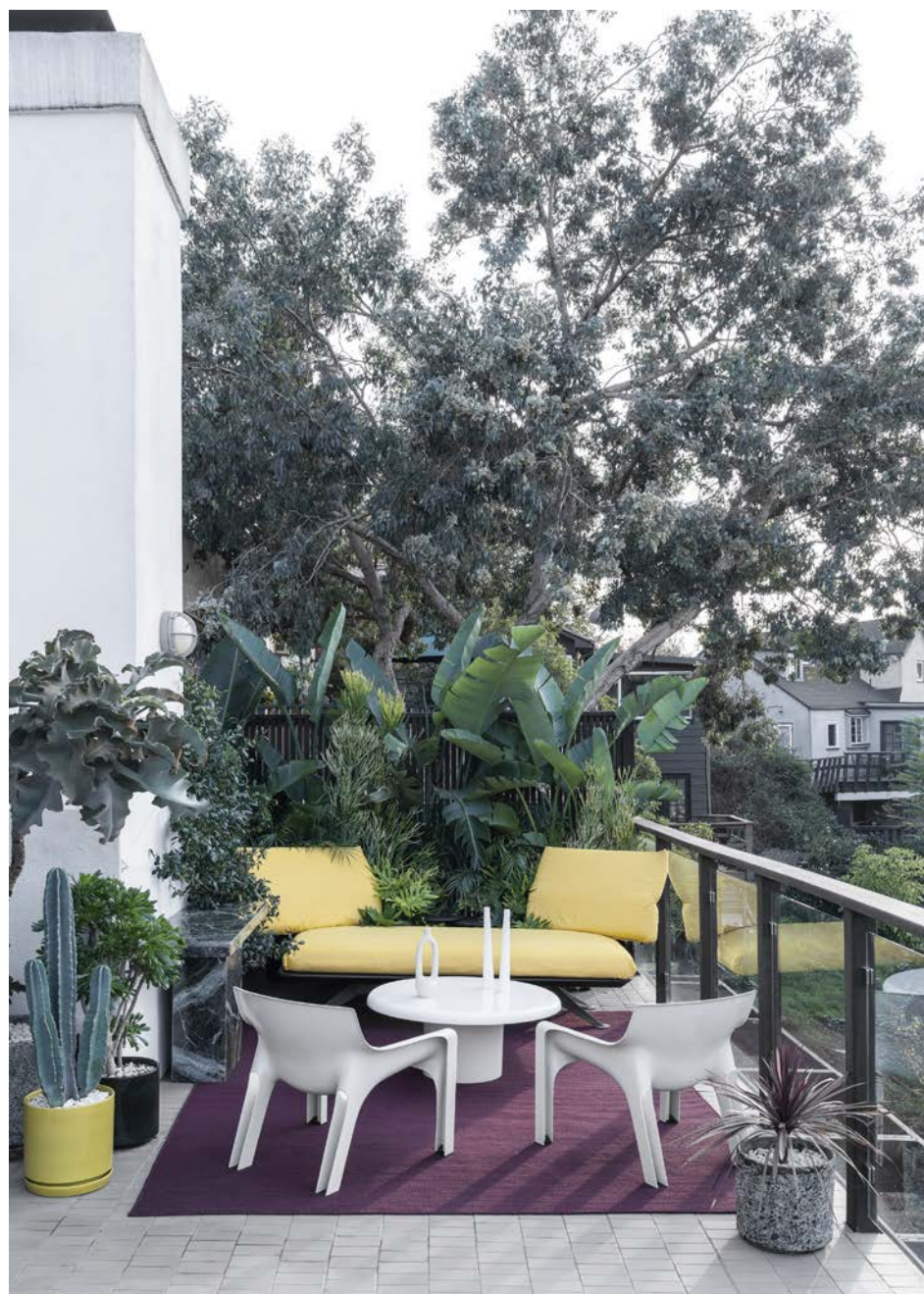
Den rummelige terrasse er indrettet med et pift af 80'erne i form af den gule sofa Adia af Paola Pivo for B&B Italia, sofabordet Nintendo og stolene Vicario af Vico Magistretti fra 70'erne.

I hjemmets bløde hjørne står modulsofaerne Orbis af Luigi Colani for Cor fra 70'erne og den hvide Elda-lænestol fra 60'erne af Joe Colombo. Marmorbordet Jumbo er af Gae Aulenti for Knoll fra 1965. På det står en hvid hånd af Giò Ponti for Richard Ginori, den sorte er vintage. Sidebordet er af Osvaldo Borsani for Tecno. Det blå værk er Oltremare Piegato af Cesare Berlingeri, og til højre hænger maleriet Two Hands af John Baldassari. Den patinerede træskulptur er skabt af senufo-folket fra Elfenbenskysten.