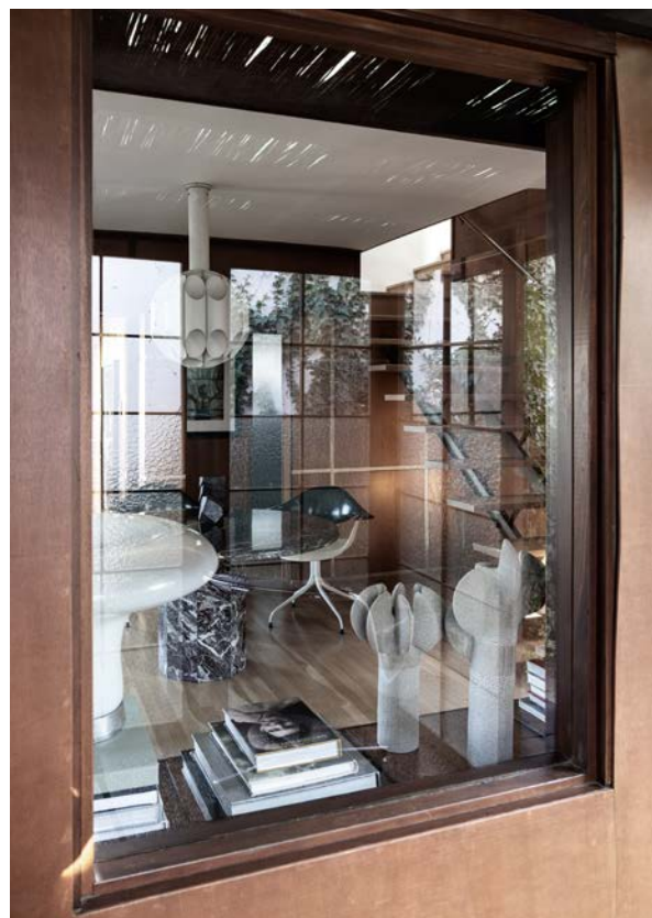
Et kig udefra til spiseområdet og trappen.