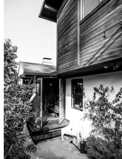
Huset set udefra med Vico Magistrettis stol Gaudi for Artemide ved indgangspartiet.