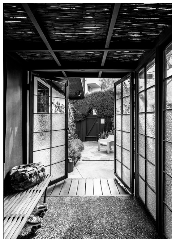
Det fine indgangsparti er skabt af træpaneler og glaseret glas. Bænken er af George Nelson.