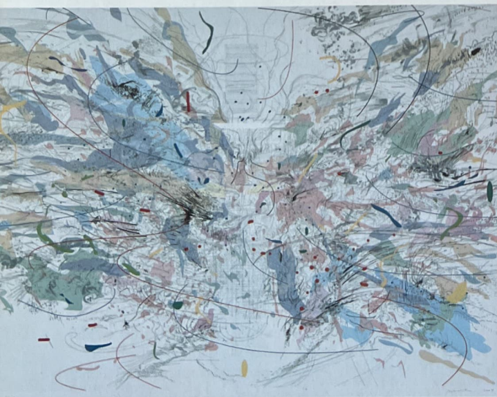
Arriba, una de las obras del Hammer Museum: Entropia , de Julie Mehretu.

«A solo cinco minutos en coche de las oficinas de Oliver Peoples está uno de mis sitios preferidos de Los Ángeles: la Casa Stahl . Es uno de los mejores ejemplos de la arquitectura del siglo XX; en ella, Pierre Koenig redefinió el concepto de vivienda a través de materiales de siempre aplicados de un modo distinto. Es algo que me resulta muy inspirador».