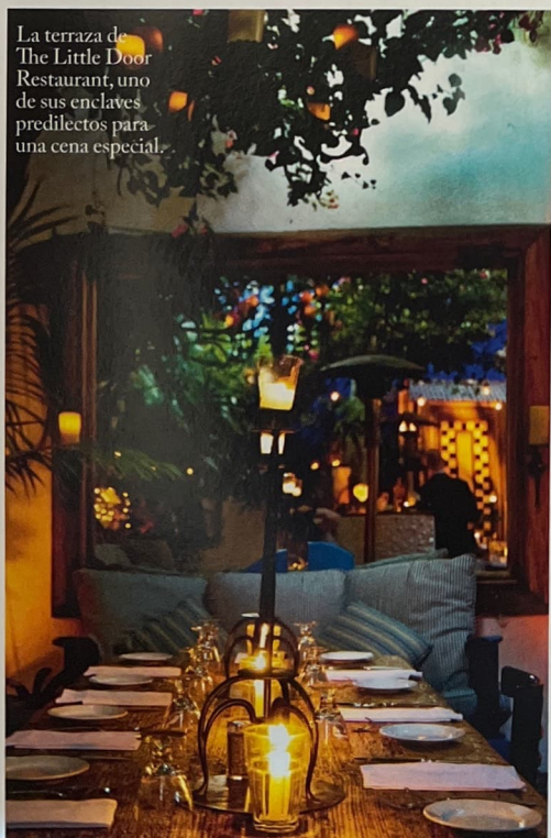
La terraza de The Little Door Restaurant , uno de sus enclaves predilectos para una cena especial.