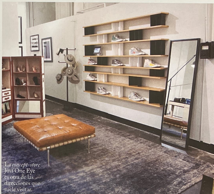
La concept-store Just One Eye es otra de las direcciones que suele visitar.