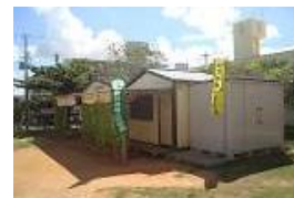
自治会事務所 (銘苅3丁目てんとうむし公園内)