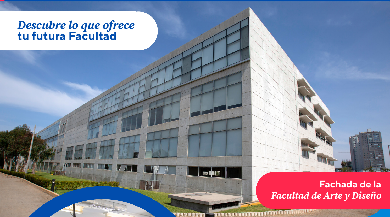
Fachada de la Facultad de Arte y Diseño

Descubre lo que ofrece tu futura Facultad