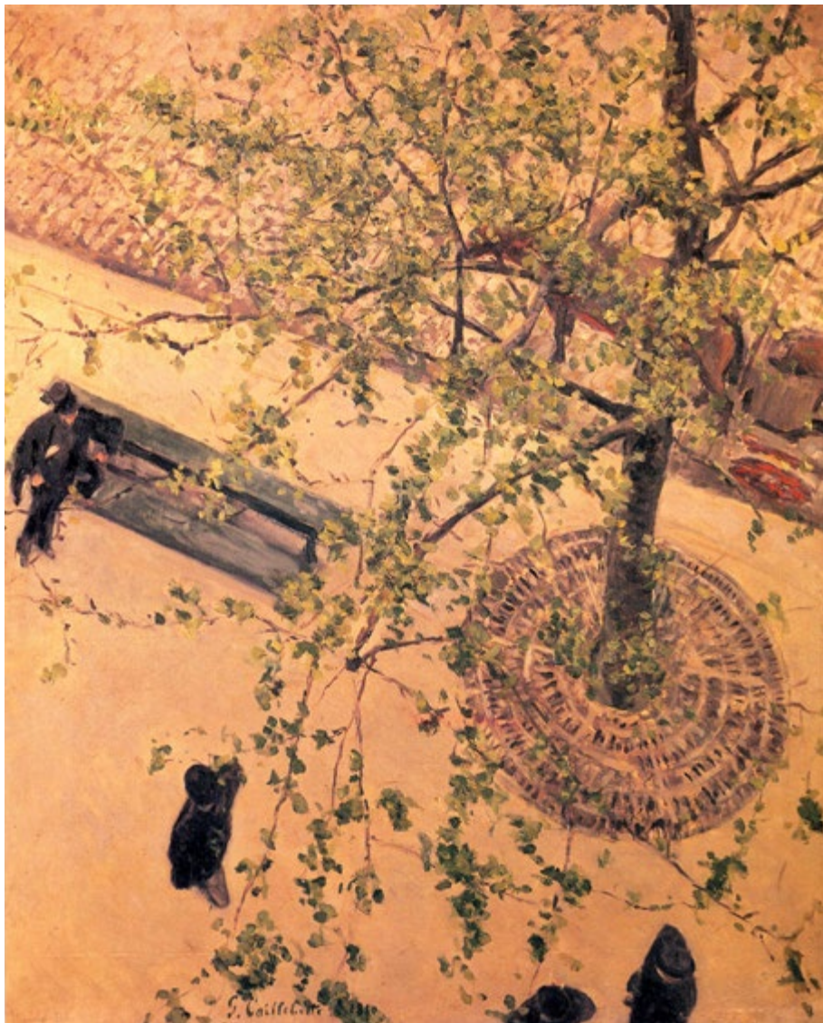
Gustave Caillebotte The Boulevard Viewed from Above, 1880. Olio su tela