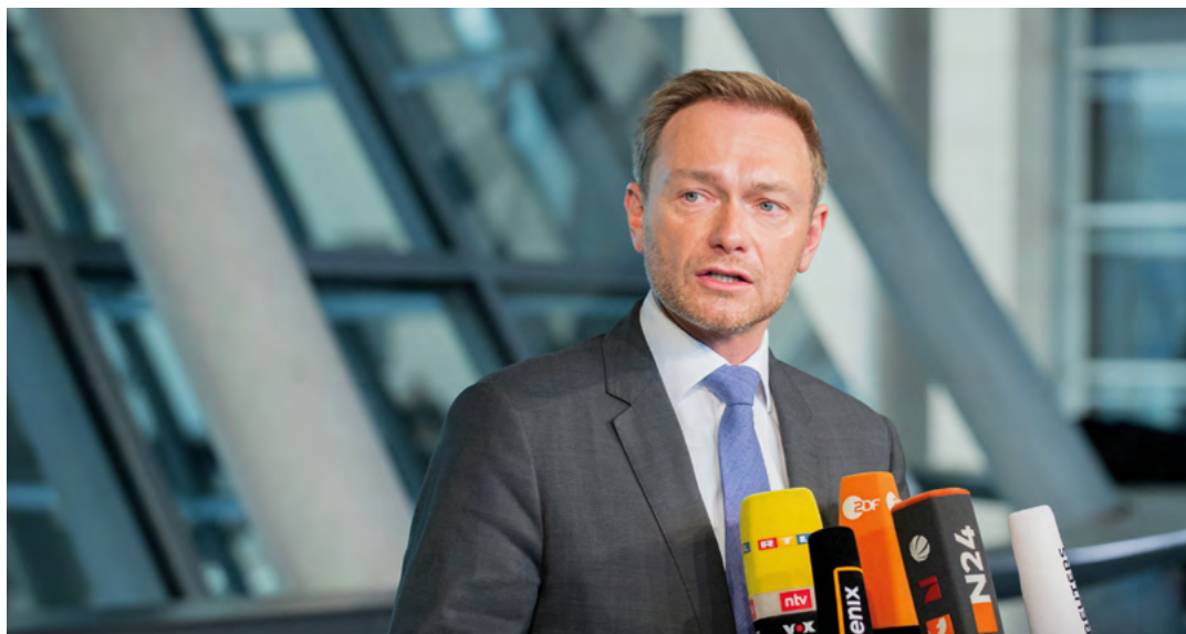
Christian Lindner, leider van de FDP