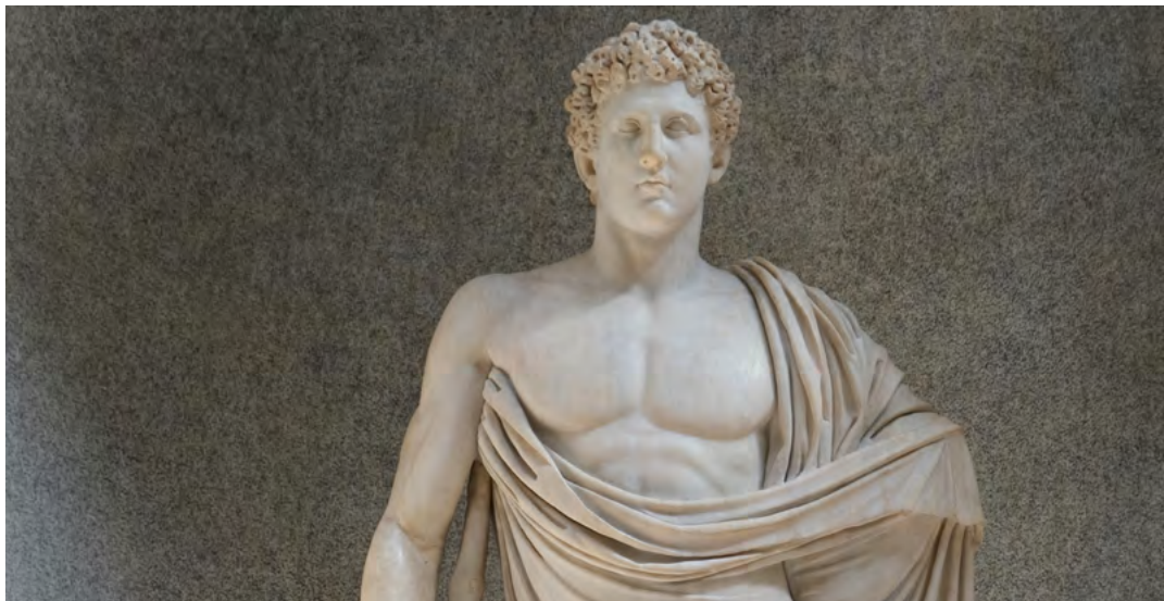
De Griekse en Romeinse god Asclepius | god van de geneeskunst

Liberale Reflecties is een uitgave van de Prof.mr. B.M. TeldersStichting.