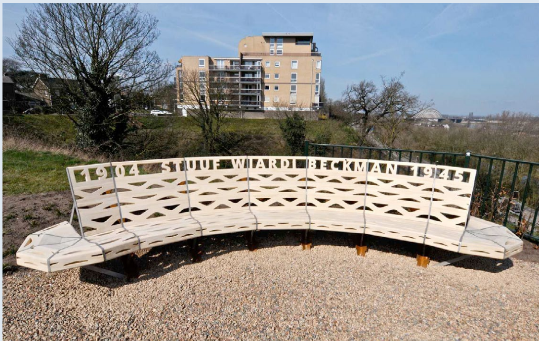
Foto onder: herdenkingsbank ter nagedachtenis aan Wiardi Beckman, Nijmegen.

3. Er bestaan filmbelden van de repetities van het spel. Het is helaas niet gelukt de oorspronkelijke partituur te achterhalen. Wel schreef Smit een jaar later een suite voor pianosolo waarin hij de thema's van het spel verwerkte. Smit werd in het voorjaar van 1943 door de Duitsers opgepakt en op transport gesteld naar Sobibor, waar hij op 30 april werd vermoord.