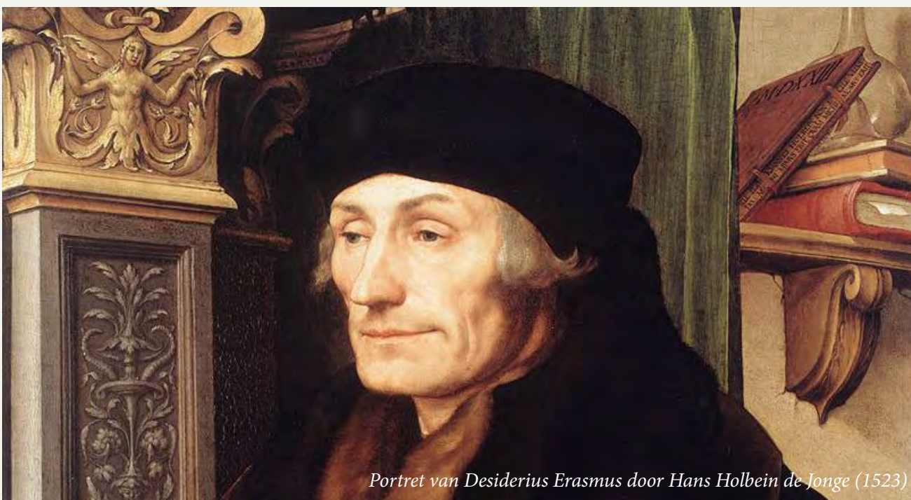
Portret van Desiderius Erasmus door Hans Holbein de Jonge (1523)

In vergelijking tot andere Europese landen gold ons land wellicht lange tijd als uiterst tolerant, doch op die tolerantie is – met een beroep op een andere ons zo kenmerkende eigenschap – wel wat af te dingen. Tolerantie moest, als gevolg van de Nederlandse neiging tot vredelievendheid en zoals wij nu zouden zeggen tot ‘polderen’, niet leiden tot scherpelijperij. ‘Alweder dat vermijden van het al te scherp omlinjende, zoo typisch voor het wezen van. dezen Staat. Het systeem,