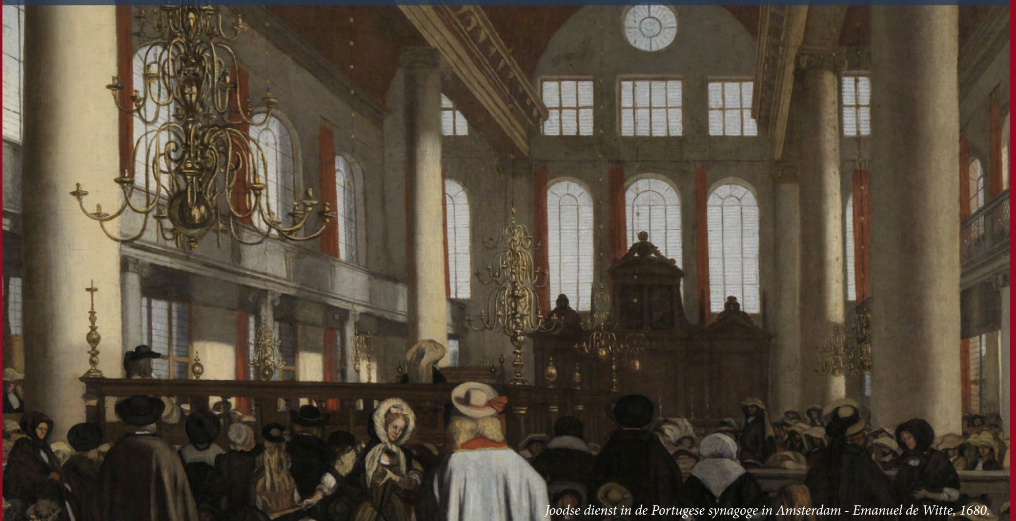
Joodse dienst in de Portugese synagoge in Amsterdam - Emanuel de Witte, 1680.

Tolerantie is juist van belang als mensen fundamenteel van mening verschillen, juist als het schuurt is het van belang ook ruimte te laten voor afwijkende meningen. Daarnaast is er aandacht voor de tolerantie-paradox, in hoeverre moet er ruimte zijn voor tolerantie jegens intoleranten? Een vraagstuk waar ook filosofen zich al over hebben gebogen. Enkele liberale denkers die zich met uitingsvrijheid en tolerantie hebben bezighouden passeren in dit Liberaal Journaal met hun gedachtengoed kort de revue.