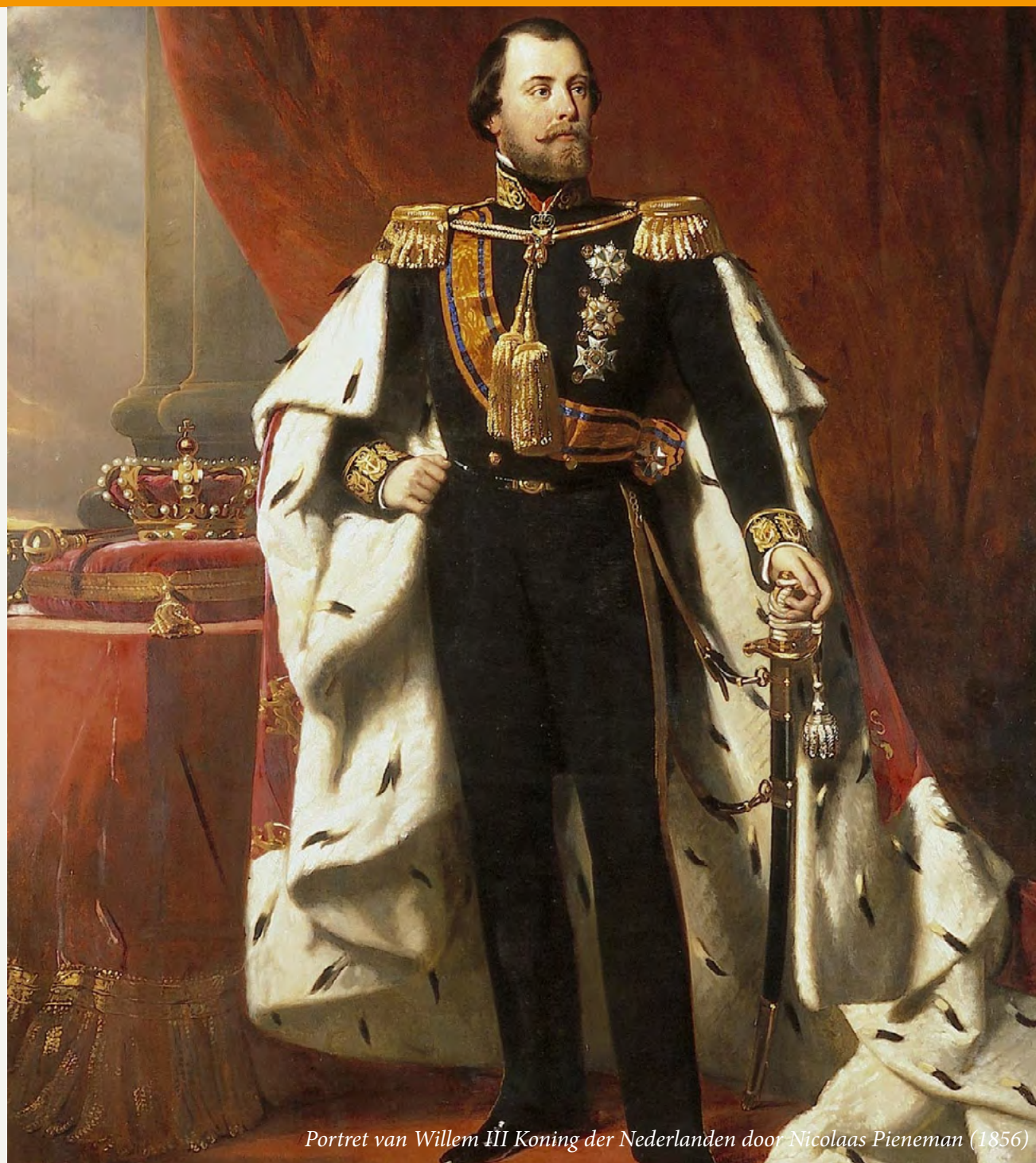
Portret van Willem III Koning der Nederlanden door Nicolaas Pieneman (1856)

dat de kerkelijke verhoudingen bepaalde, kon noch volledige godsdienstvrijheid noch principiële verdraagzaamheid heeten. Het was een praktijk, die met een oogje toedoen en af en toe eenige omkoopung het lot van de gezindten, die buiten de officieele Kerk stonden, zeer dragelijk maakte', aldus Huizinga in zijn De Nederlandse beschaving in de zeventiende eeuw .