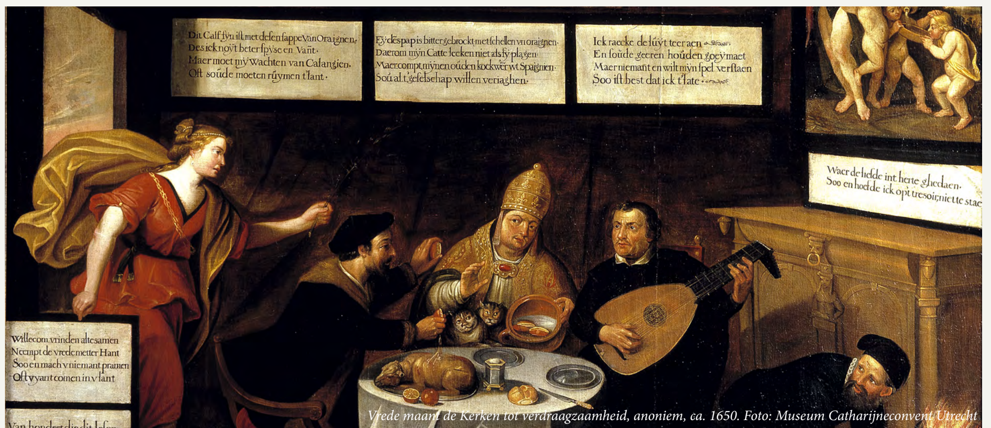
Vrede maant de Kerken tot verdraagzaamheid, anoniem, ca. 1650.