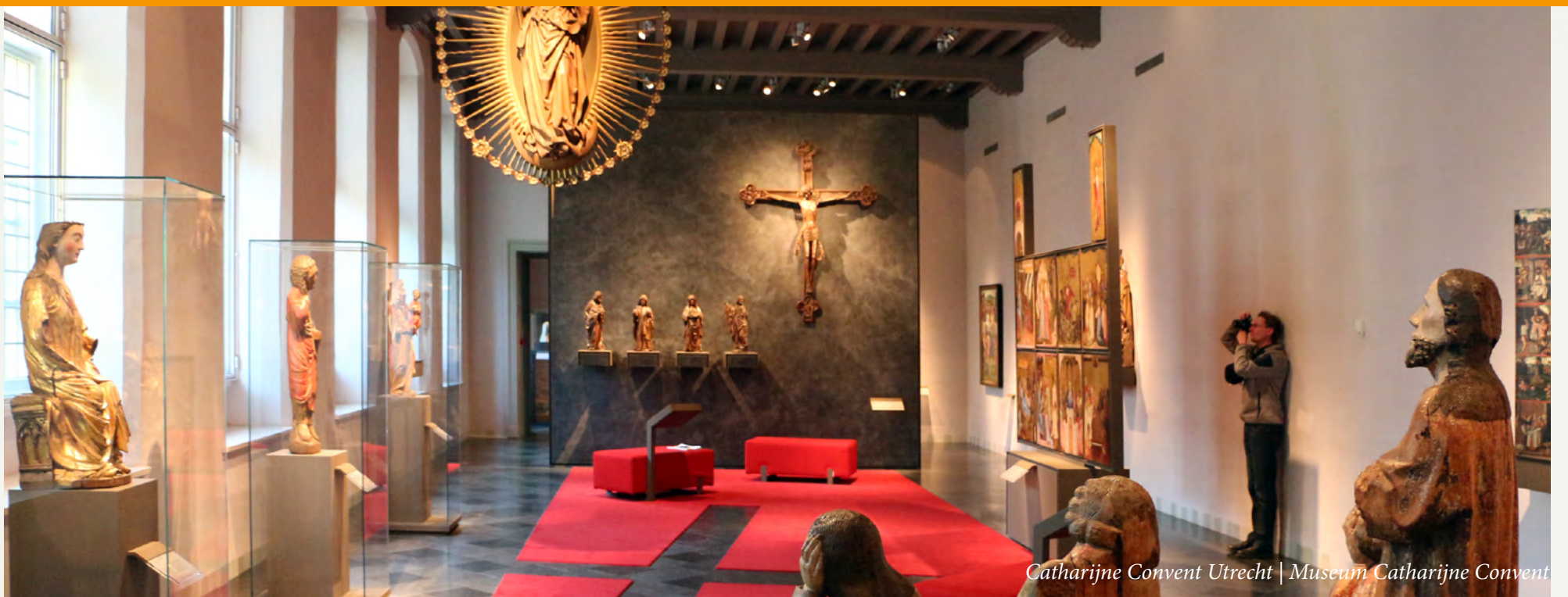
Catharijne Convent Utrecht | Museum Catharijne Convent