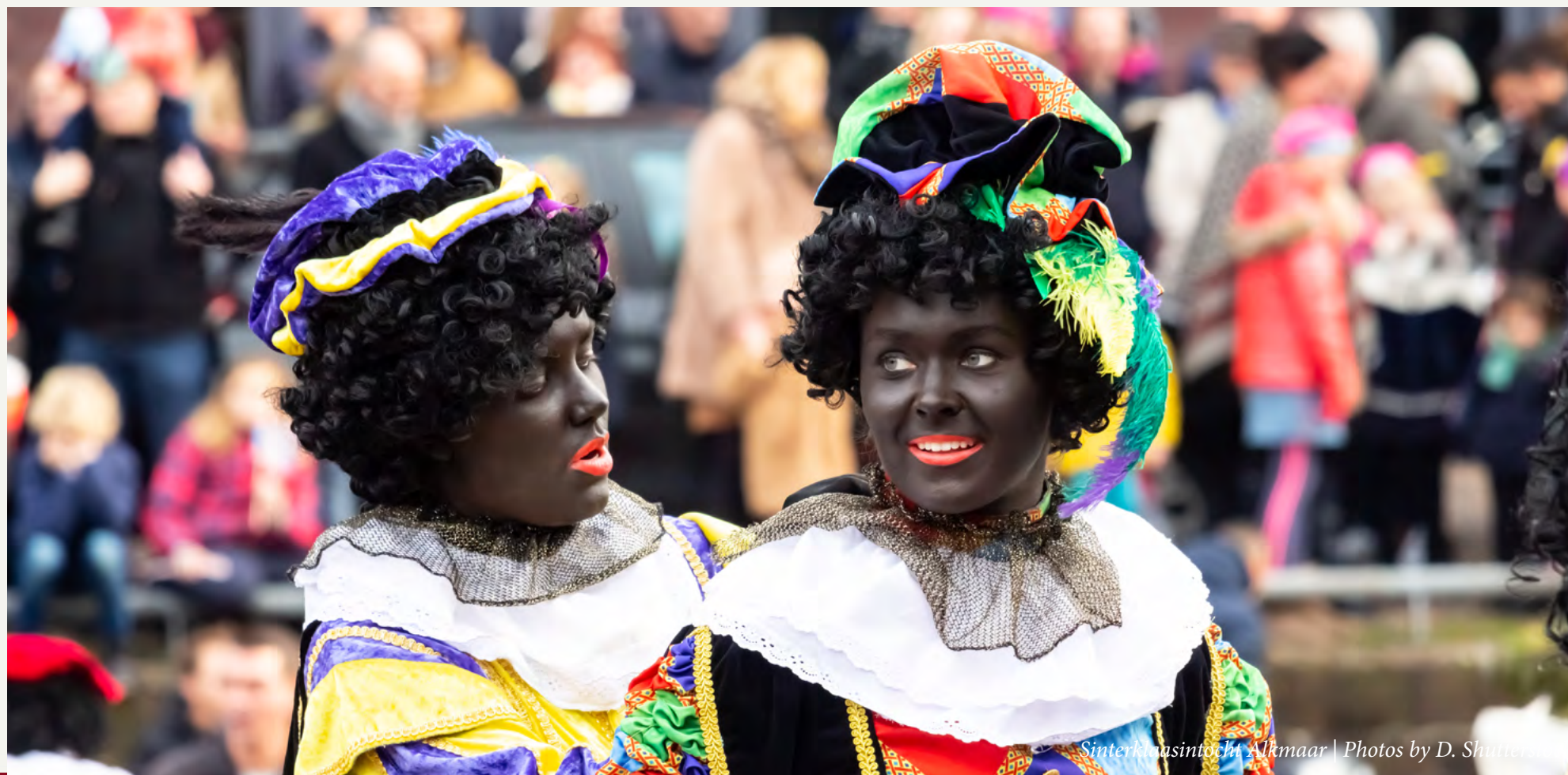
Sinterklaasintocht Alkmaar

Klaas Dijkhoff is fractievoorzitter van de VVD in de Tweede Kamer.