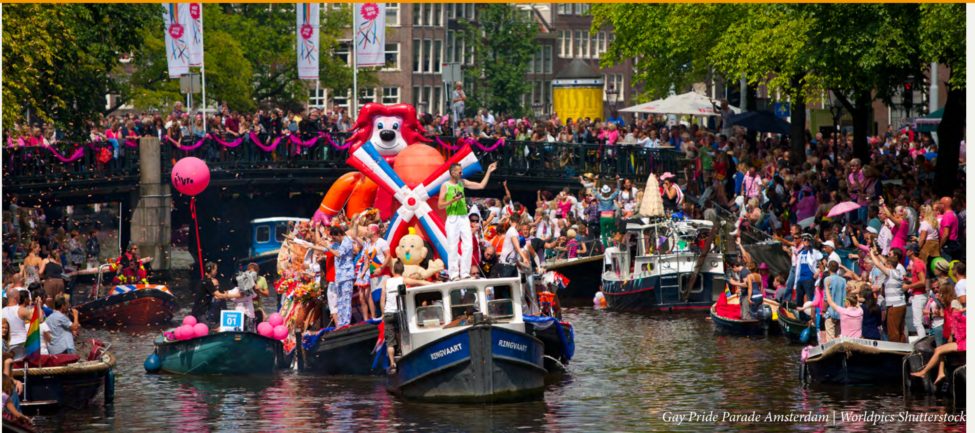
Gay Pride Parade Amsterdam