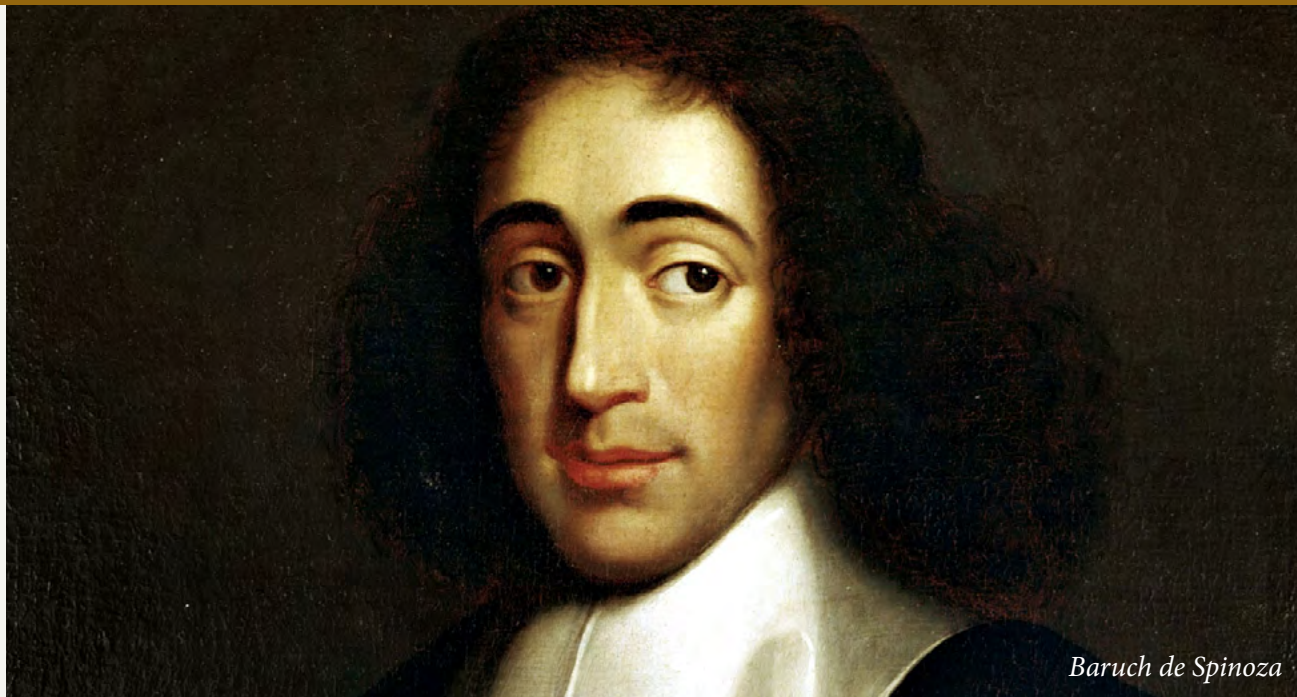
Baruch de Spinoza

Verlichtingsdenker Spinoza – eveneens van Nederlandse origine – was net als Coornhert voor vergaande gewetensvrijheid en een scheiding van kerk en staat. Spinoza was voor een radicale scheiding tussen godsdienst en politieke macht, waarbij de kerk zich afzijdig diende te houden van de staat, terwijl de staat de speelruimte van de kerk bepaalde. Religieuze leiders misbruikten, aldus Spinoza, hun ambt en daarmee gepaard gaande macht meer dan eens om de individuele gewetensvrijheid geweld aan te doen. Ook werd religie misbruikt om tweedracht te zaaien en de bevolking in bedwang te houden.