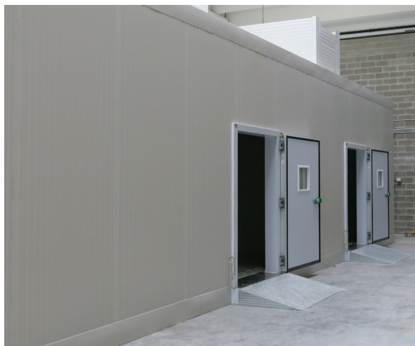
SUITE DI TEST NORMATIVO PER ACS Camere climatiche e sistema di test per ripetibilità e accuratezza

Test normativo per pompe di calore con compressore elettrico per la produzione di acqua calda sanitaria ACS secondo EN-16147