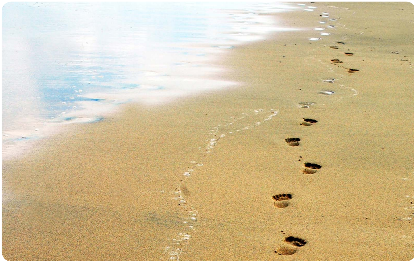
«Die Menschen sind mit der Erde verwurzelt, der Geist besitzt Flügel». Cisi Laughing Crow