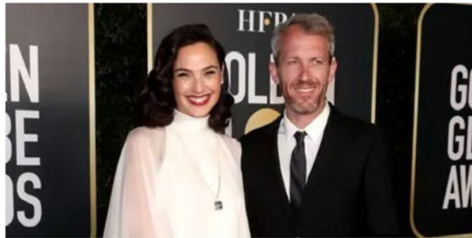
غال غادوت تعلن حملها الثالث بصورة.. وإطلاق بيضاء في حفل غولدن غلوب