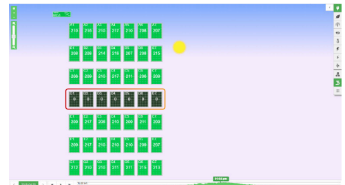
SCHNELLE IDENTIFIZIERUNG VON PROBLEMEN MIT DATEN AUF PV-MODULEBENE