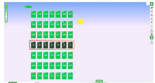
RÁPIDAMENTE IDENTIFIQUE PROBLEMAS USANDO DATOS DE NIVEL DE MÓDULO

Las alertas automáticas por correo electrónico o SMS resaltan fallas del sistema o problemas de rendimiento. Las alertas de rendimiento contribuyen al mantenimiento proactivo y a un menor costo de propiedad. Reciba informes de producción mensuales o diarios.