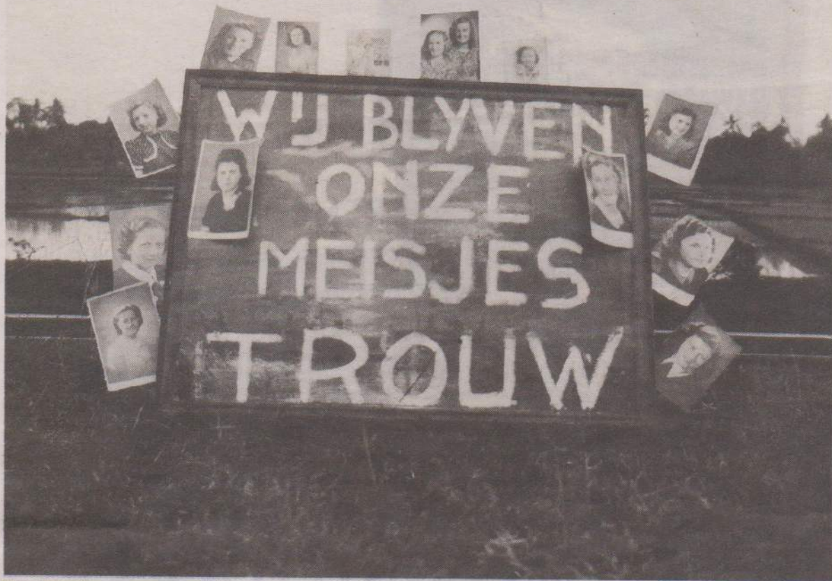
Een shot uit een propagandafilm waarmee het Nederlandse leger het thuisfront probeerde gerust te stellen.