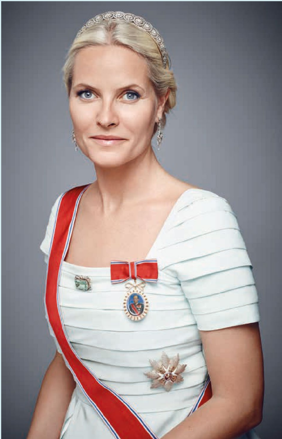
H.K.H. Kronprinsesse Mette-Marit.