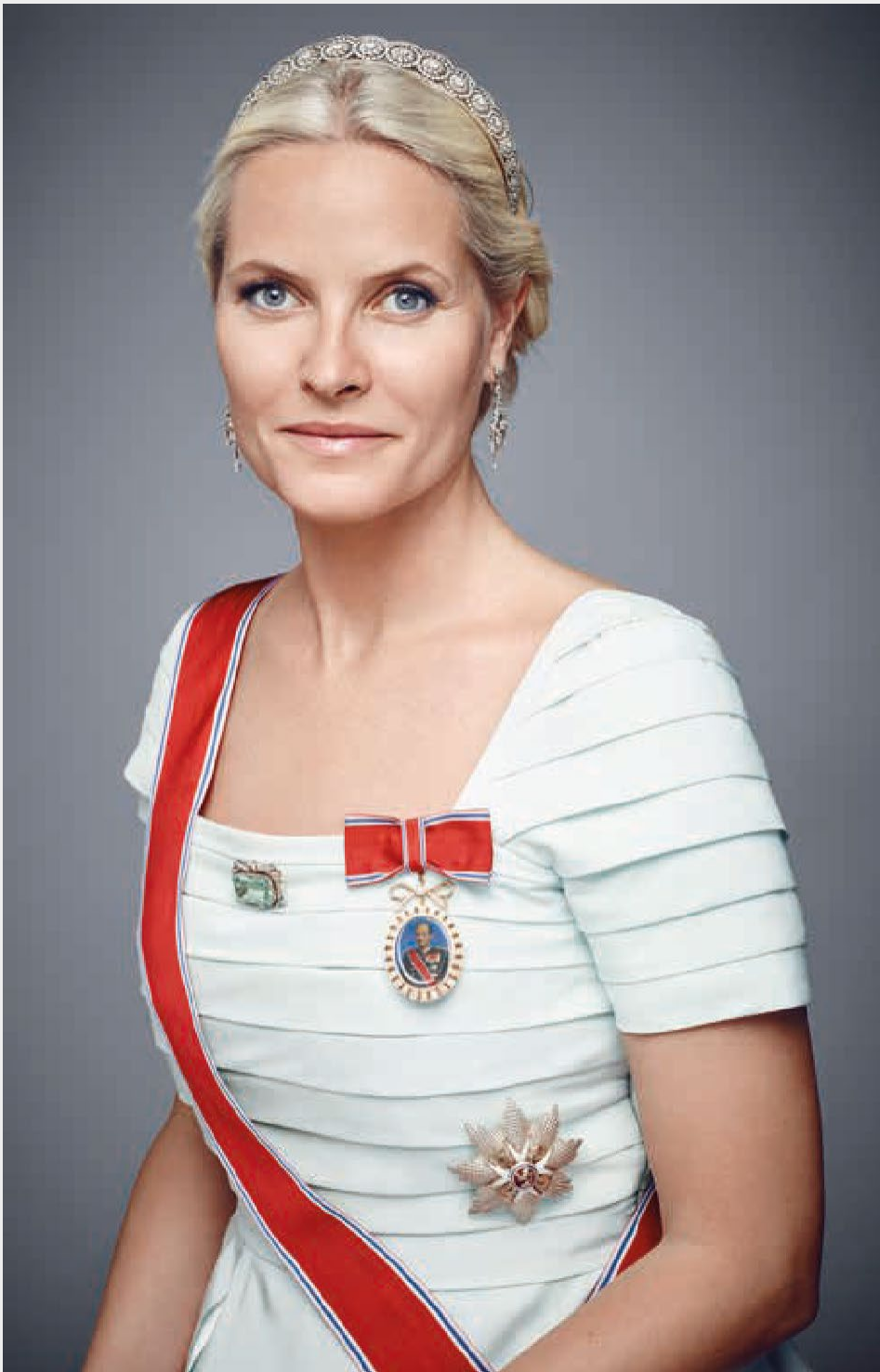
H.K.H. Kronprinsesse Mette-Marit.