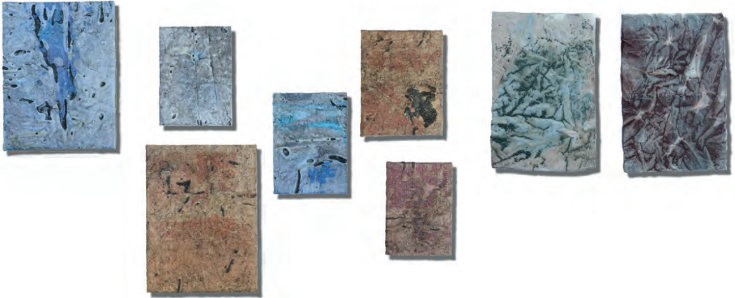
Kleinformatige Lichtreflexionen auf Wasseroberflächen der Malta, Lieser und des Millstätter Sees; 2018, Sediment und Wachs auf Baumwolle über Leimfarbe auf Papier, sonnenbestrahlt, verschiedene Größen