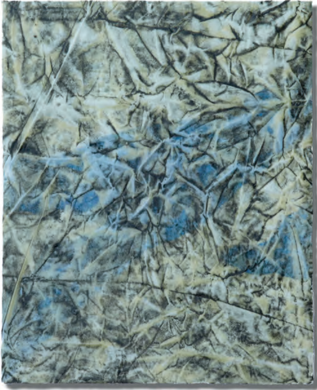
oben: Schroff, das Geschiebe (Lieser) , 2018, Sediment und Wachs auf Baumwolle über Leimfarbe auf Papier, sonnenbestrahlt, 62,5 x 50 cm