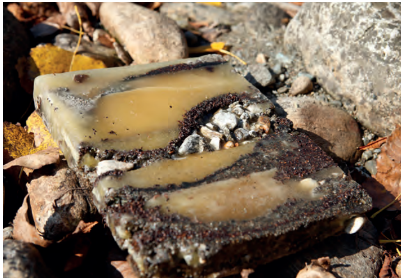
links: Sedimentbild Malta, 1 bis 4 , 2018, Sediment und Wachs, 27 x 22 cm