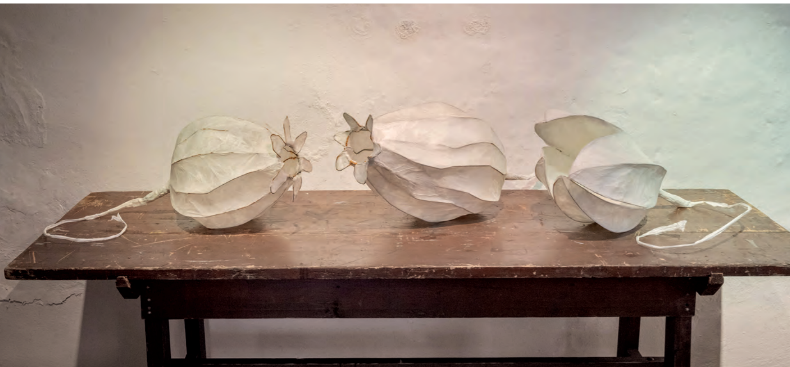
3 Samenkapseln, Papier, Draht, Fett links 30cm x 50cm x 30cm Mitte 35cm x 60cm x 35cm rechts 30cm x 50cm x 30cm