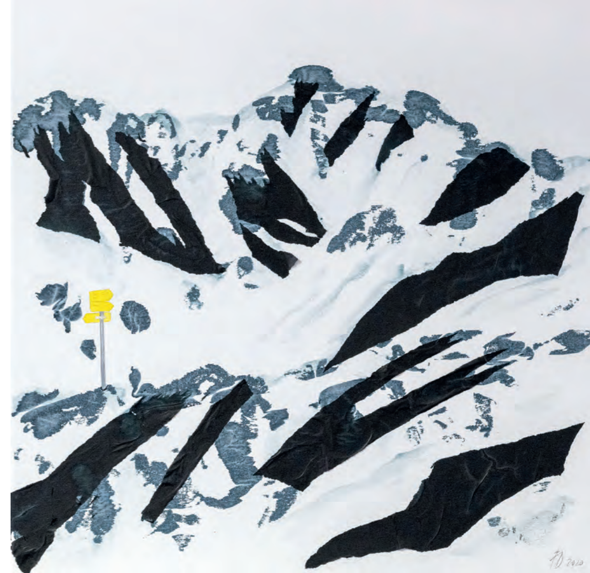
Seite 3: Hochalmspitze, Papier, Acryl auf Baumwolle, 60cm x 60cm