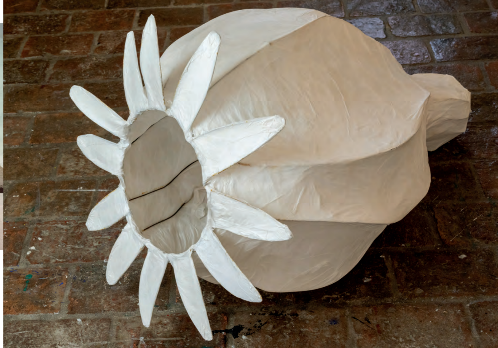
Rechte Seite: Mohnkapsel, Papier, Draht, Fett 70cm x 110cm x 65cm