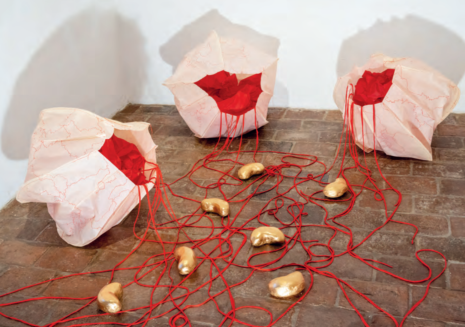
Growth and Expansion, Energie fließt in die Stadt, Pergamentpapier genäht, Acryl, Seidenpapier, Textil, ca. 60cm x 2,5m x 4m