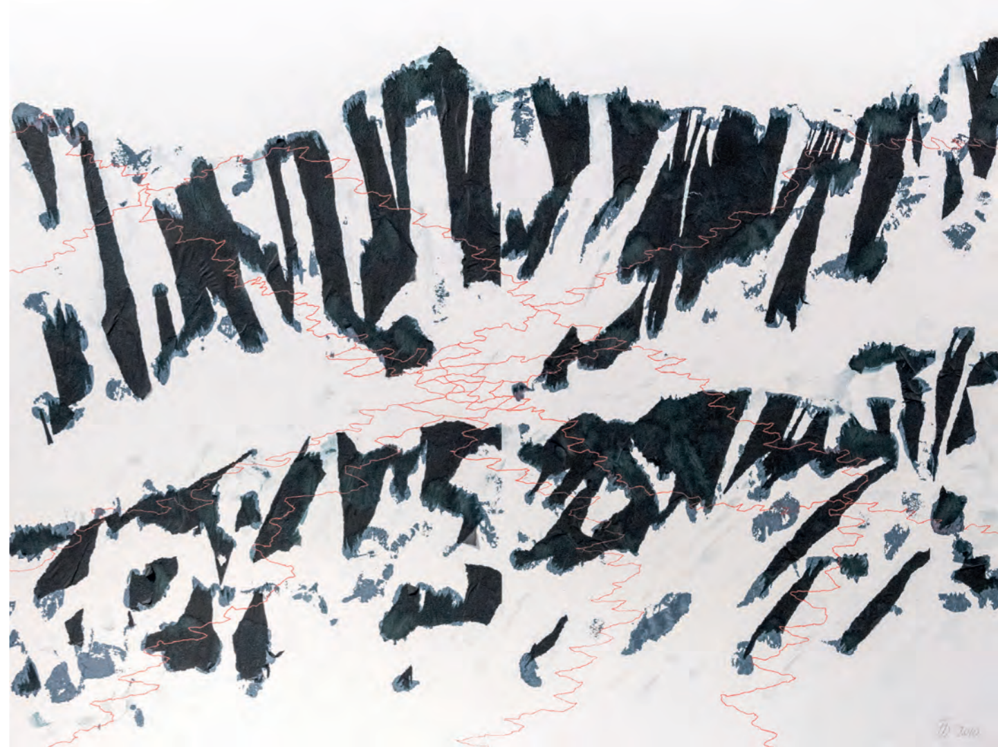
Rechte Seite: Brunnkar Spitze, Papier, Acryl auf Baumwolle, 80cm x 100cm