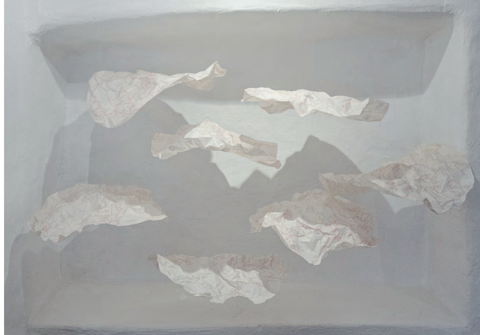
Rechte Seite: Fliegende Welten, Topografien rund um Gmünd, Pergament Papier, Polychromos, Faden, je 50cm x 50cm

35 Gmündner Frauen zeigen ihre Solidarität mit Eva Faschauner, die 1773 nach dem letzten Inquisitionsprozess in Gmünd enthauptet wurde, nachdem ihr die rechte Hand abgetrennt worden war.