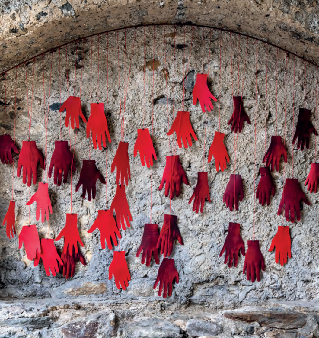
Meine rechte Hand für Eva Faschauner Installation im Maltator, Gmünd Print auf Karton, Faden, Blei 140cm x 160cm

35 Gmündner Frauen zeigen ihre Solidarität mit Eva Faschauner, die 1773 nach dem letzten Inquisitionsprozess in Gmünd enthauptet wurde, nachdem ihr die rechte Hand abgetrennt worden war.