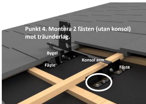
Infästning på träunderlag

Max konsolvstånd 1200 mm (minskas på särskilt hårt utsatta ytor/områden). Komplett konsol 6033 för plana takpannor.