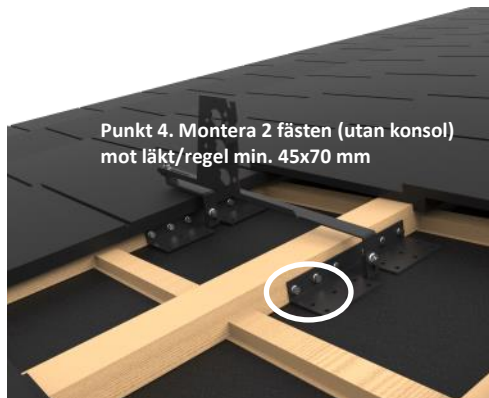
Infästning mot bärläkt