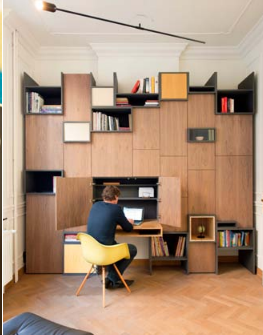
PAGINA LINKS: BOVEN, RECHTS: HET GROTE MULTIFUNCTIONELE MEUBEL WERD ONTWERPEN DOOR FILIP JANSSENS ( WWW.FILIPJANSSENS.BE ), 'PLASTIC ARMCHAIR' VAN CHARLES & RAY EAMES (VITRA), ZOLDERINGLAMP 'STILL LIGHT' VAN NATHALIE DEWEEZ (FELD). ONDER, LINKS: DE LEEFRUIMTE MET LAMP VAN JULES WABBES (L'JEVER & DUCRÉ), TAPIJT 'COLOUR CARPET' VAN SCHOLTEN & BAIJINGS (HAY, BIJ YDEE) EN KUSSENS VAN MISSONI. ONDER, RECHTS: OP DE HAARD VAN PLEISTERKALK (FIRMA JANS) STAAT EEN 'EAMES HOUSE BIRD' (VITRA).

Van hun jonge jaren in Brussel herinneren Yves en Veerle zich nog de ochtenden dat ze de rommelmarkt op het Vossenplein afschuimden en - vooral - het appartement in Laken, waar ze die gesnuijsterde schatten een plaatsje gaven: hoge plafonds, opeenvolgende kamers, dubbele deuren en een schitterende lichtinval... Toen dachten ze al: "Als we ooit een huis in deze stijl vonden, dāt zou pas fantastisch zijn!" Na hun studies ging het stel in Amsterdam werken. Een aantal jaren later, in 2000, besloten ze terug naar België te verhuizen. Omdat een herenhuis in Brussel zowat onbetaalbaar bleek, vatten ze het plan op om er zelf één te bouwen in hun - goedkopere - geboortestreek Limburg en namen ze contact op met een immobieliënagent in Sint-Truiden. Toen ze hun auto voor het kantoor parkeerden, zagen ze vlakbij een huis te koop staan. Nieuwsgierig gluurden ze door het raam. Wat ze zagen, overtrof al hun verwachtingen. Dit was het huis van hun dromen!