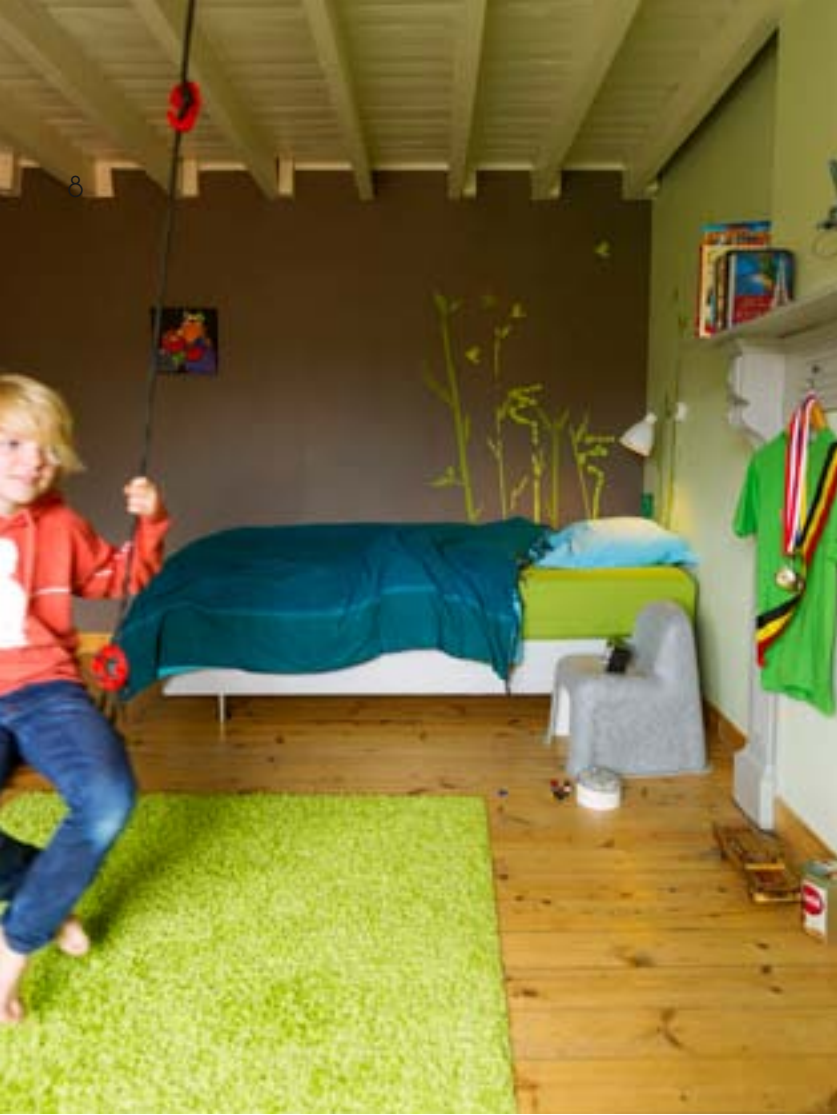
BOVEN: DE KAMER VAN JOSSE. PLAID HABITAT, KINDERSTOEL 'LITTLE NOBODY' VAN HAY BIJ YDEE. ONDER: DE KAMER VAN ELLA. KEWLOX-MEUBELTJES MET DAAROP EEN WASTAFEL. MAP 'PLISSÉ' EN STOEL 'J77', BEIDE HAY BIJ YDEE.