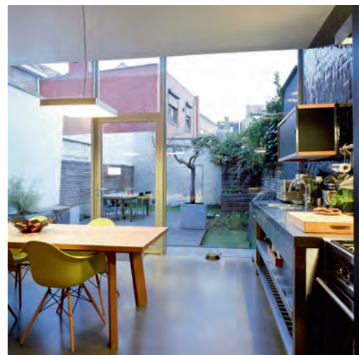
DE GLAZEN ACHTERGEVEL HAALT VOLOP DAGLICHT NAAR BINNEN.