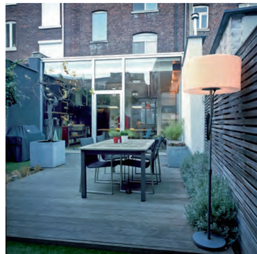
ONDANKS DE GERINGE OPPERVLAKTE IS ER TOCH NOG PLAATS VOOR EEN GEZELLIG STADSTUINJE.