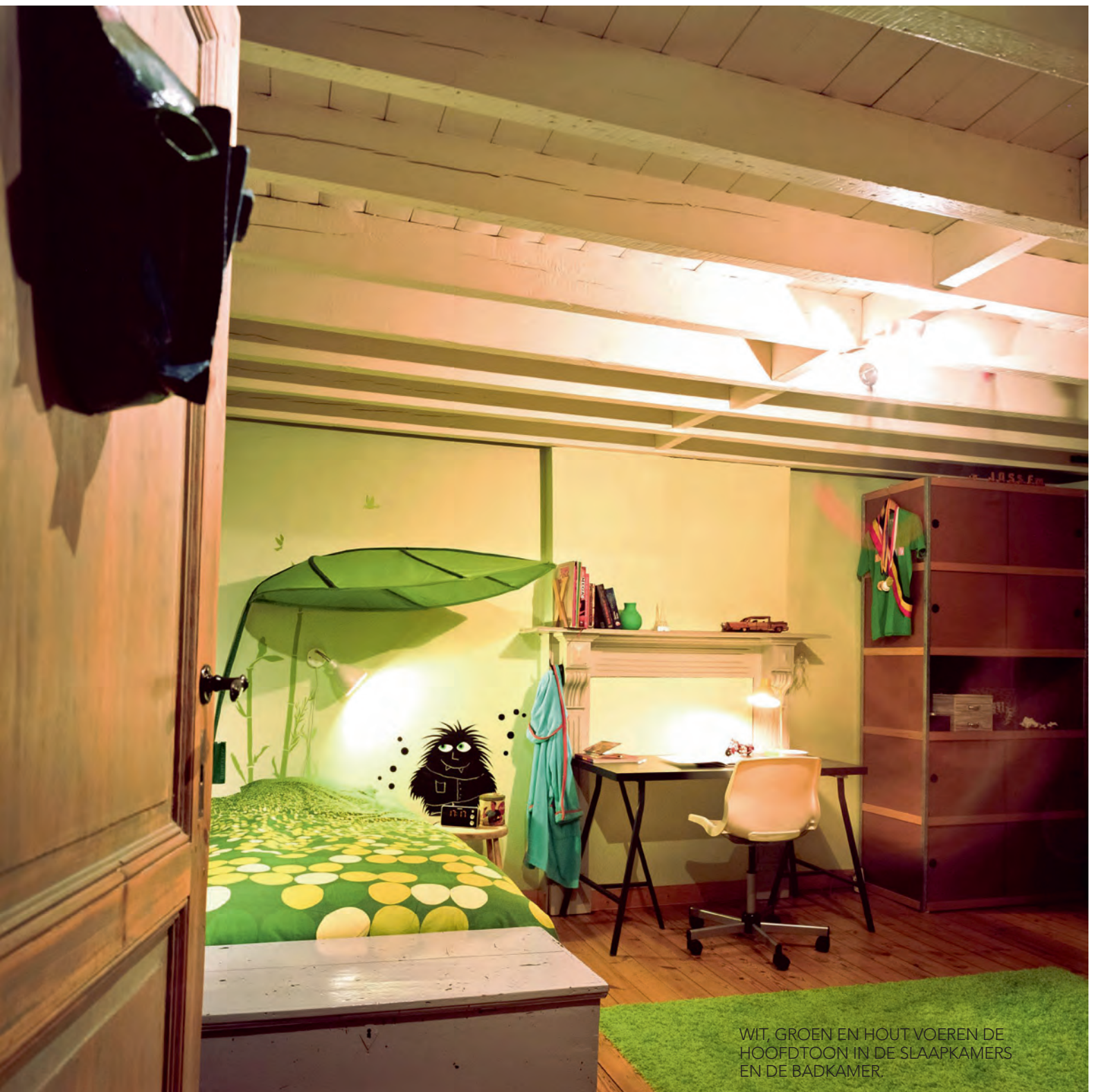
WIT, GROEN EN HOUT VOEREN DE HOOFDTON IN DE SLAAPKAMERS EN DE BADKAMER.