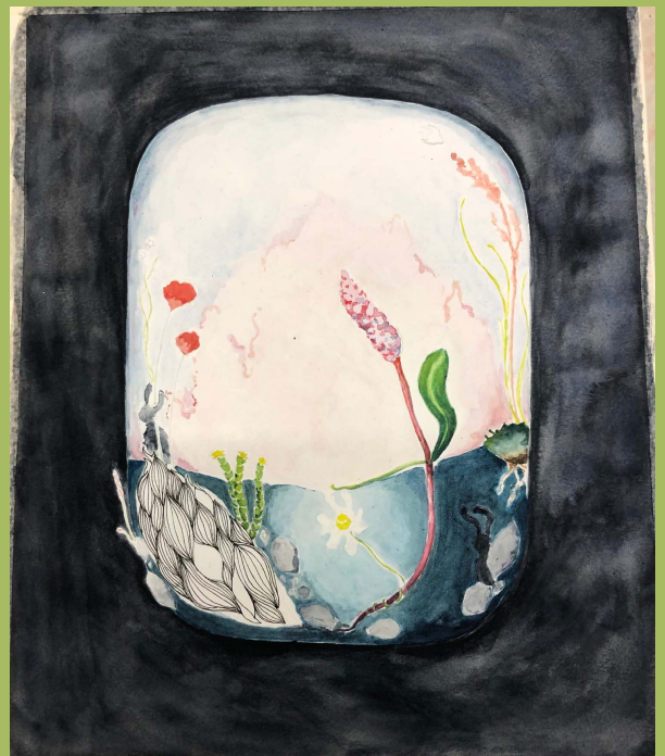
Töitä ennen tussia