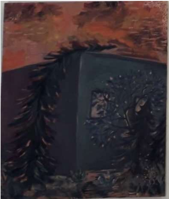
4. taivutettu puu