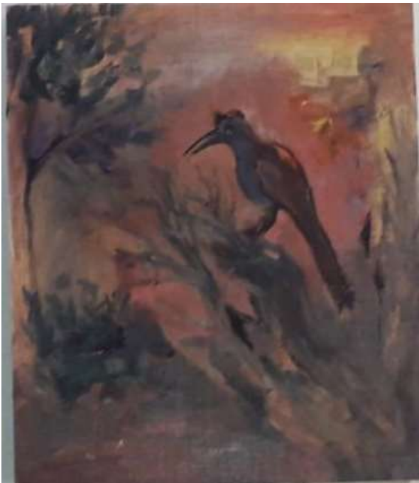
2. hirviö (lintu?)