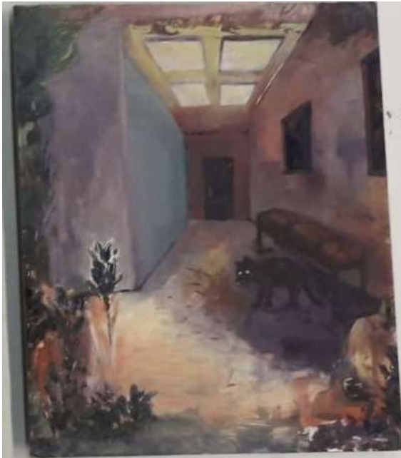
6. kissa ja hiiri