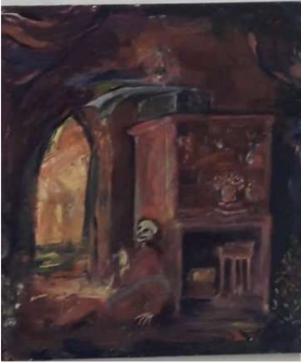
1. ikuinen odotus