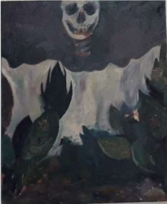
5. yön ötökät/saalis