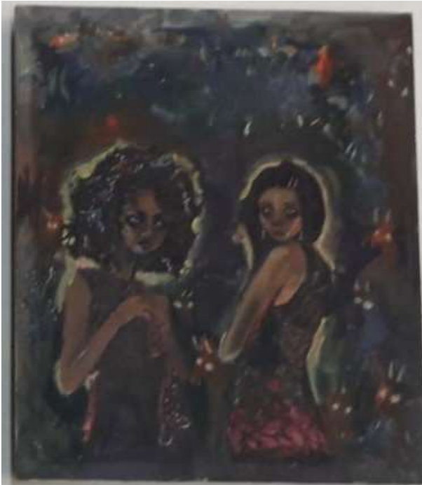
3. jotain hehkua