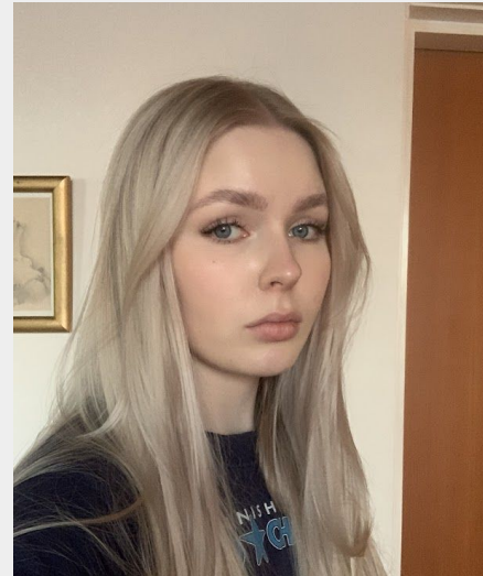
Kuvat, joista otin mallia teoksiin